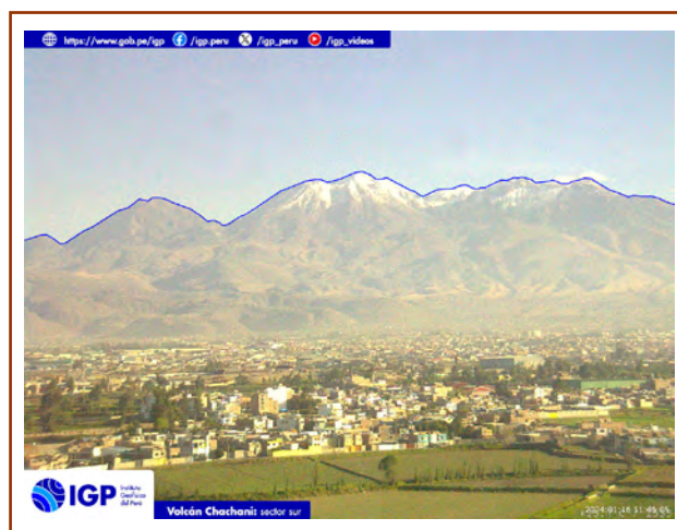
Figura 4. Fotografía del volcán Chachani del día de hoy. La hora corresponde al formato UTC.