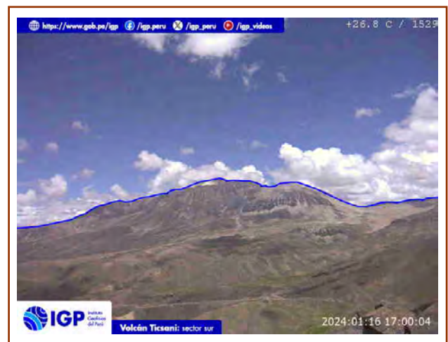
Figura 5. Fotografía del volcán Ticsani del día de hoy. La hora corresponde al formato UTC.