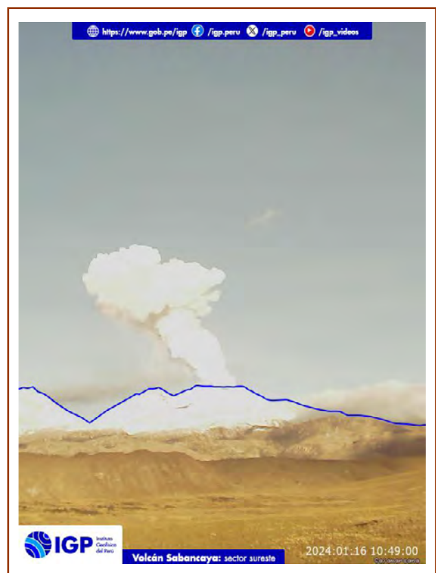
Figura 1. Fotografía del volcán Sabancaya del día de hoy. La hora corresponde al formato UTC.