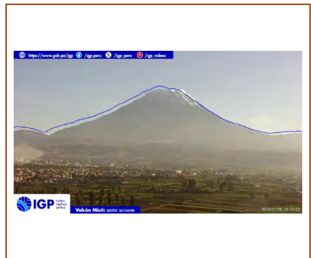
Figura 3. Fotografía del volcán Misti del día de hoy. La hora corresponde al formato UTC.