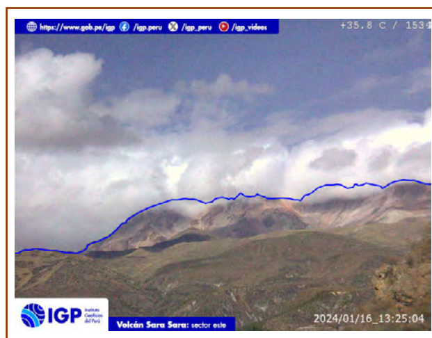
Figura 7. Fotografía del volcán Sara Sara del día de hoy. La hora corresponde al formato UTC.