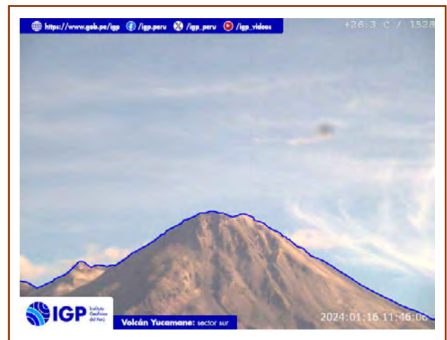
Figura 8. Fotografía del volcán Yucamane del día de hoy. La hora corresponde al formato UTC.