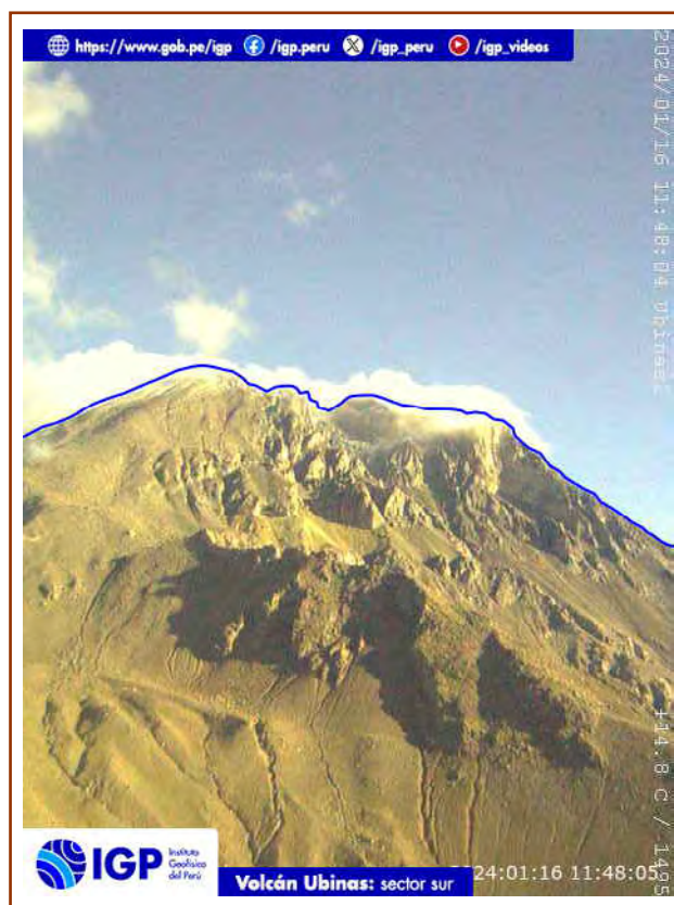
Figura 2. Fotografía del volcán Ubinas del día de hoy. La hora corresponde al formato UTC.