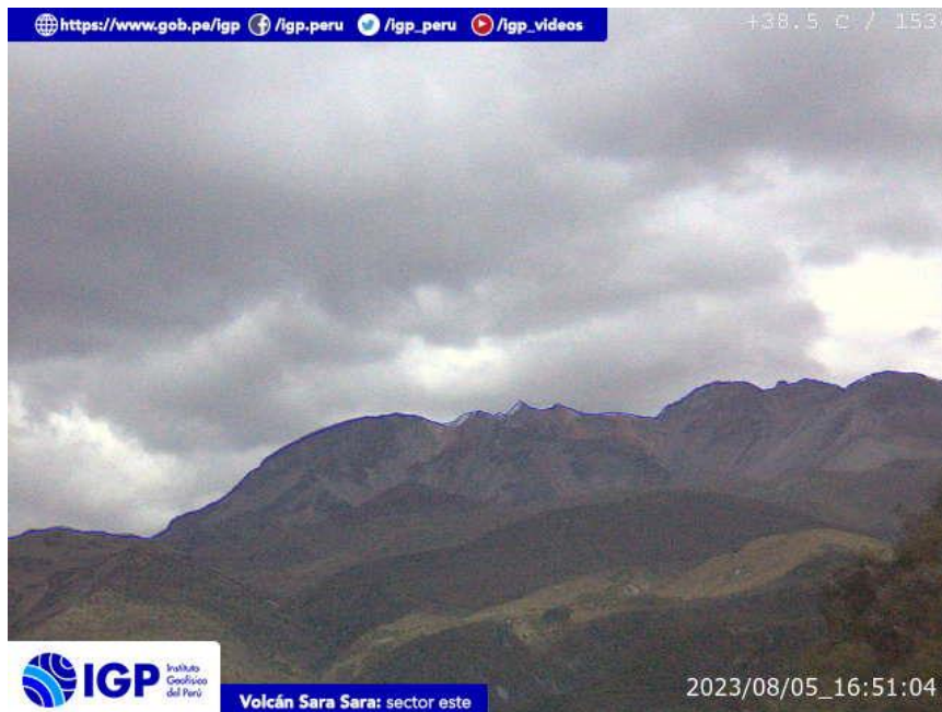
Figura 9.- Imagen de monitoreo del volcán Sara Sara capturada por la cámara de monitoreo Sara Sara, ubicada en el sector este del volcán. La hora corresponde a formato UTC.