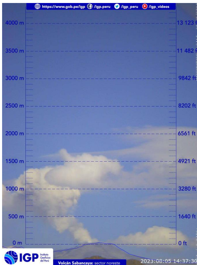
Figura 2.- Imagen de monitoreo del volcán Sabancaya capturada por la cámara de monitoreo Chivay, ubicada en el sector noreste del volcán. La hora corresponde a formato UTC.

Nivel de alerta volcánica actual: naranja .