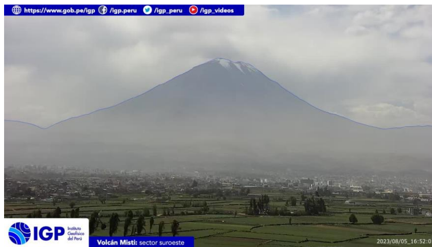
Figura 3.- Imagen de monitoreo del volcán Misti capturada por la cámara de monitoreo Misti 1, ubicada en el sector suroeste del volcán. La hora corresponde a formato UTC.