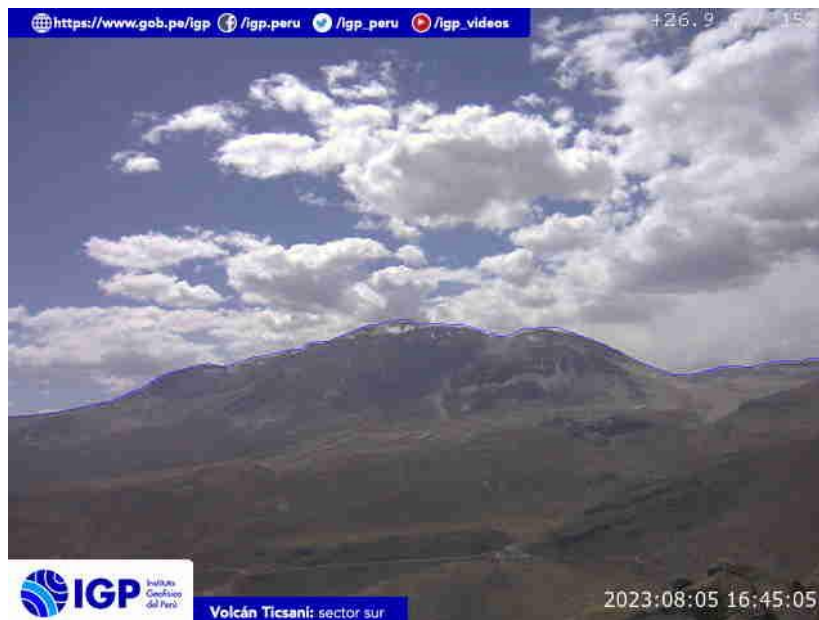
Figura 7.- Imagen de monitoreo del volcán Ticsani capturada por la cámara de monitoreo Ticsani 1, ubicada en el sector sur del volcán. La hora corresponde a formato UTC.