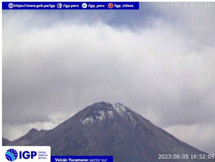
Figura 8.- Imagen de monitoreo del volcán Yucamane capturada por la cámara de monitoreo Yucamane, ubicada en el sector sur del volcán. La hora corresponde a formato UTC.