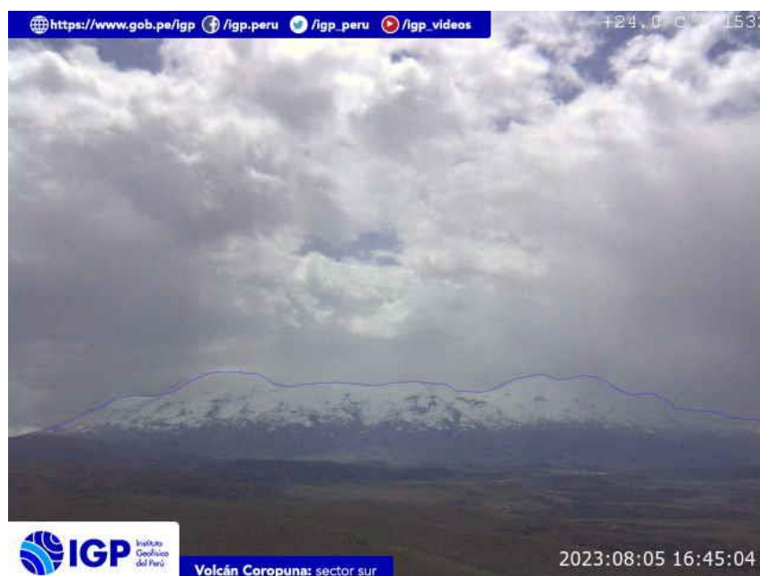
Figura 5.- Imagen de monitoreo del volcán Coropuna capturada por la cámara de monitoreo Coropuna 1, ubicada en el sector sur del volcán. La hora corresponde a formato UTC.