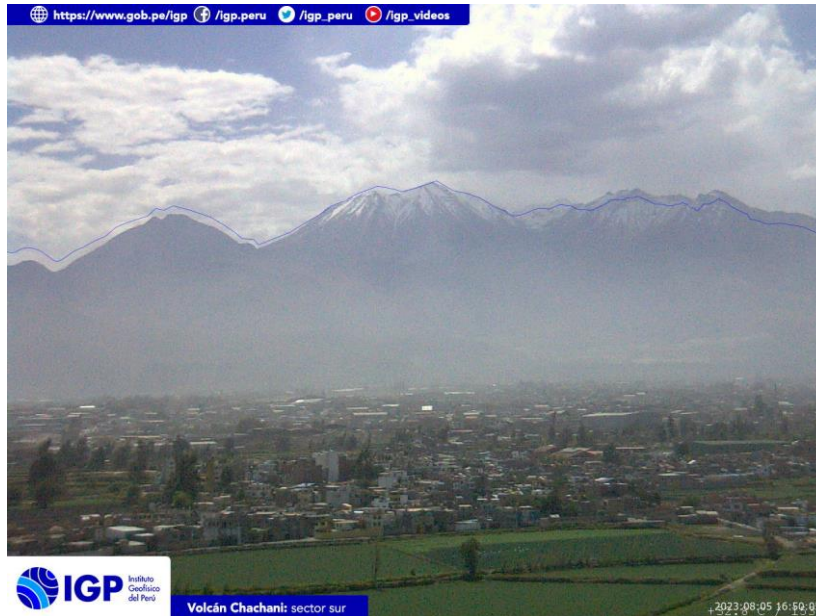
Figura 4.- Imagen de monitoreo del volcán Chachani capturada por la cámara de monitoreo Chachani 1, ubicada en el sector sur del volcán. La hora corresponde a formato UTC.