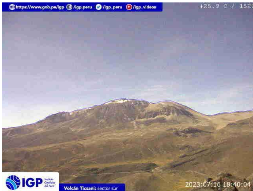
Figura 7.- Imagen de monitoreo del volcán Ticsani capturada por la cámara de monitoreo Ticsani 1, ubicada en el sector sur del volcán. La hora corresponde a formato UTC.