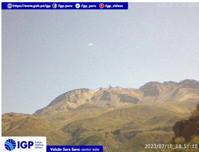
Figura 8.- Imagen de monitoreo del volcán Sara Sara capturada por la cámara de monitoreo Sara Sara, ubicada en el sector este del volcán. La hora corresponde a formato UTC.