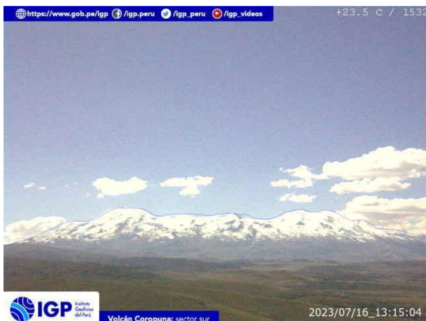
Figura 5.- Imagen de monitoreo del volcán Coropuna capturada por la cámara de monitoreo Coropuna 1, ubicada en el sector sur del volcán. La hora corresponde a formato UTC.