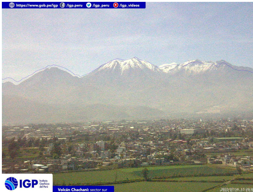
Figura 4.- Imagen de monitoreo del volcán Chachani capturada por la cámara de monitoreo Chachani 1, ubicada en el sector sur del volcán. La hora corresponde a formato UTC.