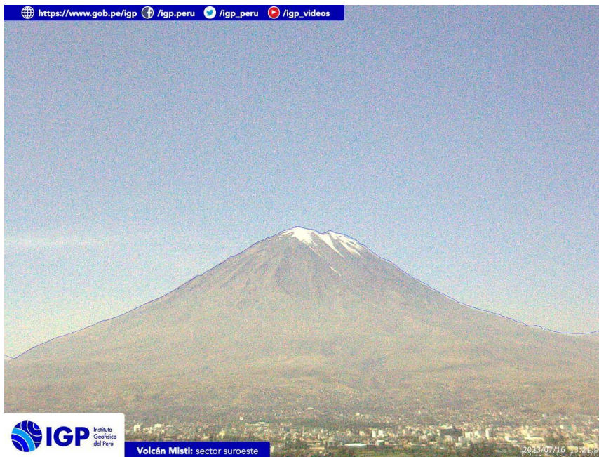
Figura 3.- Imagen de monitoreo del volcán Misti capturada por la cámara de monitoreo Misti 1, ubicada en el sector sur del volcán. La hora corresponde a formato UTC.