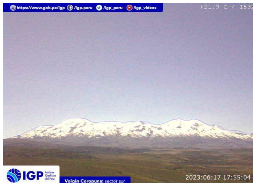
Figura 5.- Imagen de monitoreo del volcán Coropuna capturada por la cámara de monitoreo Coropuna 1, ubicada en el sector sur del volcán. La hora corresponde a formato UTC.