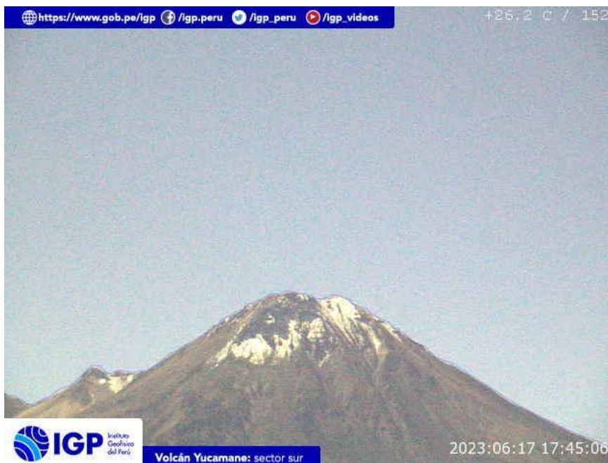
Figura 8.- Imagen de monitoreo del volcán Yucamane capturada por la cámara de monitoreo Yucamane, ubicada en el sector sur del volcán. La hora corresponde a formato UTC.