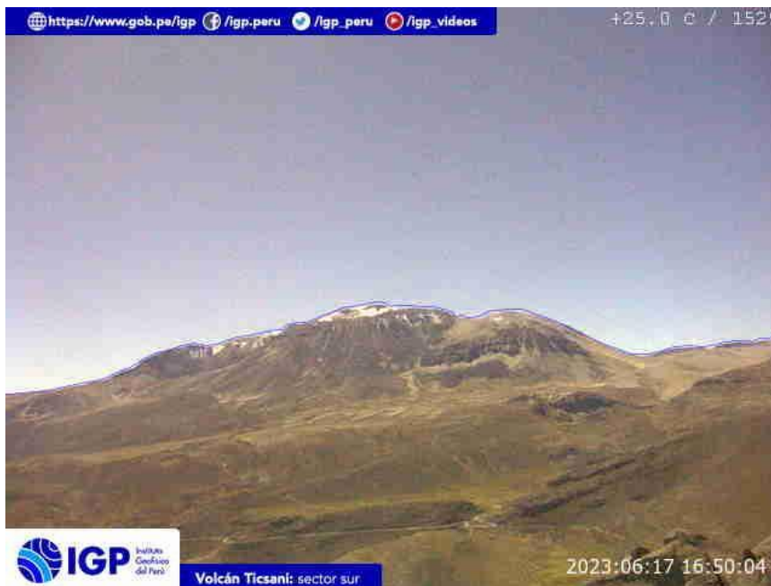
Figura 7.- Imagen de monitoreo del volcán Ticsani capturada por la cámara de monitoreo Ticsani 1, ubicada en el sector sur del volcán. La hora corresponde a formato UTC.