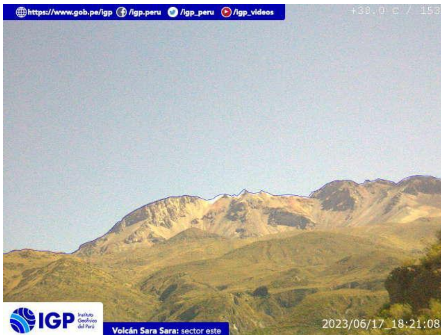
Figura 9.- Imagen de monitoreo del volcán Sara Sara capturada por la cámara de monitoreo Sara Sara, ubicada en el sector este del volcán. La hora corresponde a formato UTC.