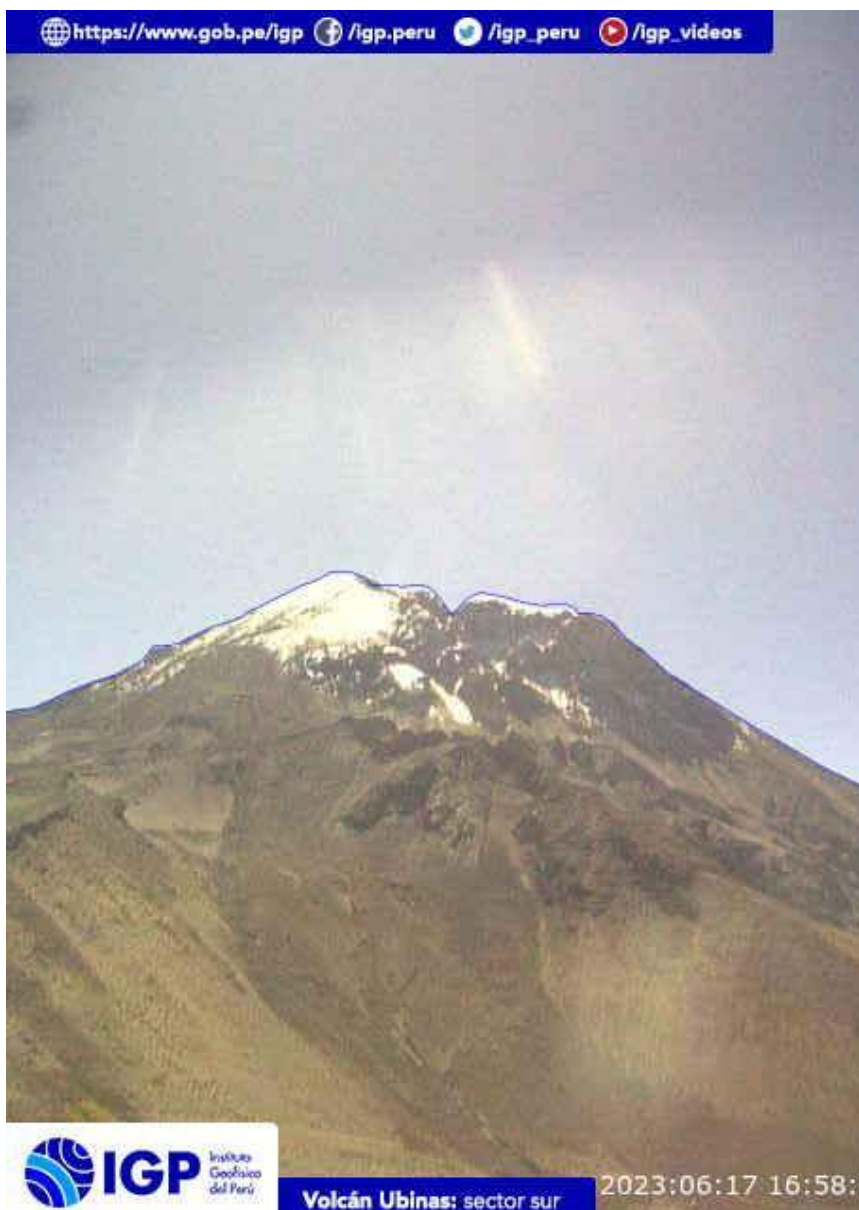
Figura 6.- Imagen de monitoreo del volcán Ubinas capturada por la cámara de monitoreo Ubinas 2, ubicada en el sector sur del volcán. La hora corresponde a formato UTC.