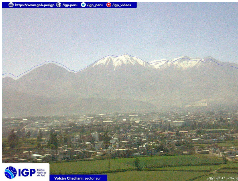
Figura 4.- Imagen de monitoreo del volcán Chachani capturada por la cámara de monitoreo Chachani 1, ubicada en el sector sur del volcán. La hora corresponde a formato UTC.