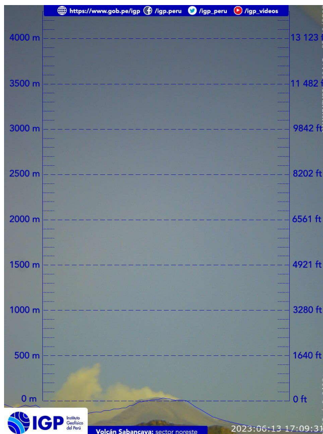
Figura 2.- Imagen de monitoreo del volcán Sabancaya capturada por la cámara de monitoreo Chivay, ubicada en el sector noreste del volcán. La hora corresponde a formato UTC.

Nivel de alerta volcánica actual: naranja .