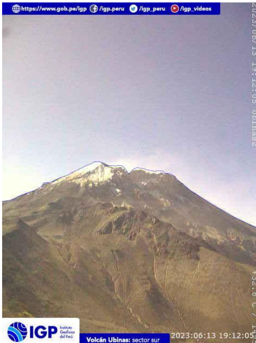
Figura 6.- Imagen de monitoreo del volcán Ubinas capturada por la cámara de monitoreo Ubinas 2, ubicada en el sector sur del volcán. La hora corresponde a formato UTC.