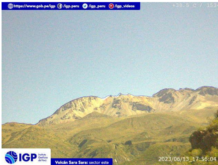
Figura 9.- Imagen de monitoreo del volcán Sara Sara capturada por la cámara de monitoreo Sara Sara, ubicada en el sector este del volcán. La hora corresponde a formato UTC.