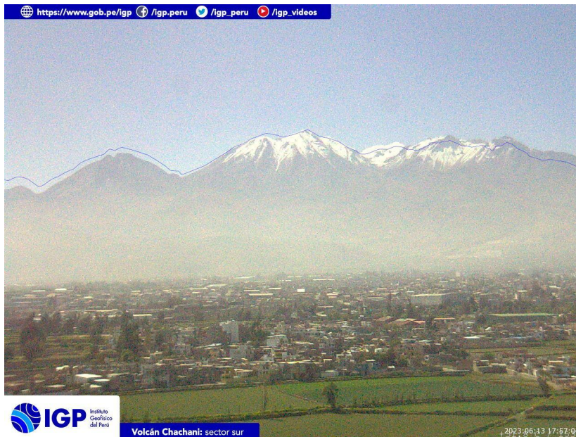
Figura 4.- Imagen de monitoreo del volcán Chachani capturada por la cámara de monitoreo Chachani 1, ubicada en el sector sur del volcán. La hora corresponde a formato UTC.