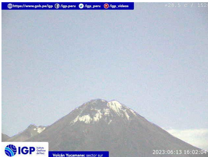
Figura 8.- Imagen de monitoreo del volcán Yucamane capturada por la cámara de monitoreo Yucamane, ubicada en el sector sur del volcán. La hora corresponde a formato UTC.