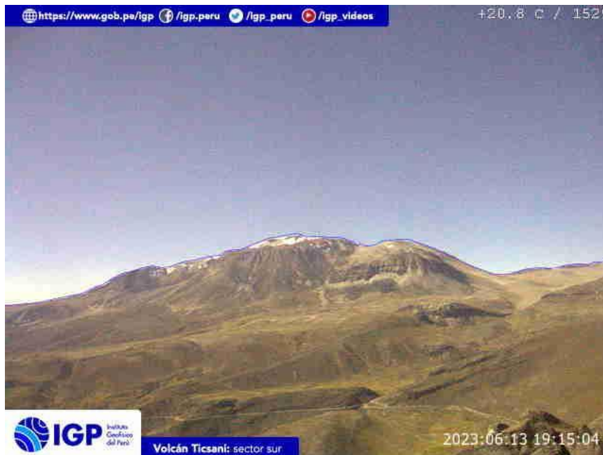
Figura 7.- Imagen de monitoreo del volcán Ticsani capturada por la cámara de monitoreo Ticsani 1, ubicada en el sector sur del volcán. La hora corresponde a formato UTC.