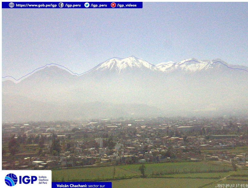
Figura 4.- Imagen de monitoreo del volcán Chachani capturada por la cámara de monitoreo Chachani 1, ubicada en el sector sur del volcán. La hora corresponde a formato UTC.