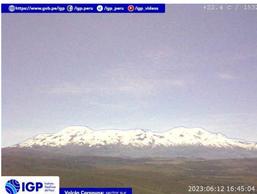
Figura 5.- Imagen de monitoreo del volcán Coropuna capturada por la cámara de monitoreo Coropuna 1, ubicada en el sector sur del volcán. La hora corresponde a formato UTC.