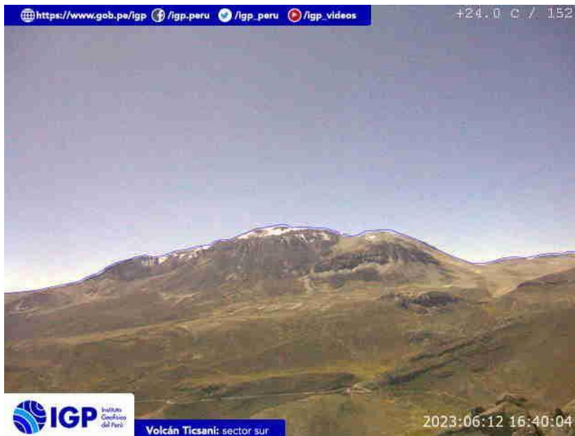
Figura 7.- Imagen de monitoreo del volcán Ticsani capturada por la cámara de monitoreo Ticsani 1, ubicada en el sector sur del volcán. La hora corresponde a formato UTC.