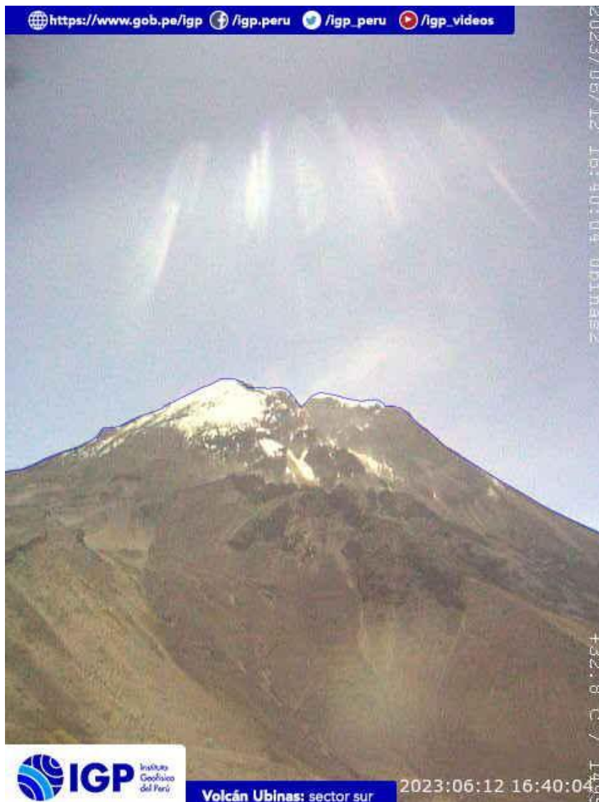
Figura 6.- Imagen de monitoreo del volcán Ubinas capturada por la cámara de monitoreo Ubinas 2, ubicada en el sector sur del volcán. La hora corresponde a formato UTC.