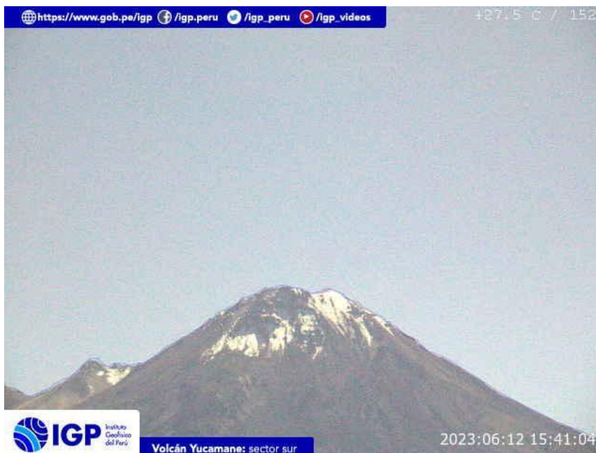
Figura 8.- Imagen de monitoreo del volcán Yucamane capturada por la cámara de monitoreo Yucamane, ubicada en el sector sur del volcán. La hora corresponde a formato UTC.