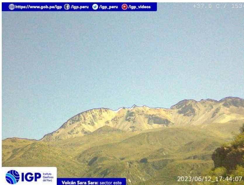
Figura 9.- Imagen de monitoreo del volcán Sara Sara capturada por la cámara de monitoreo Sara Sara, ubicada en el sector este del volcán. La hora corresponde a formato UTC.