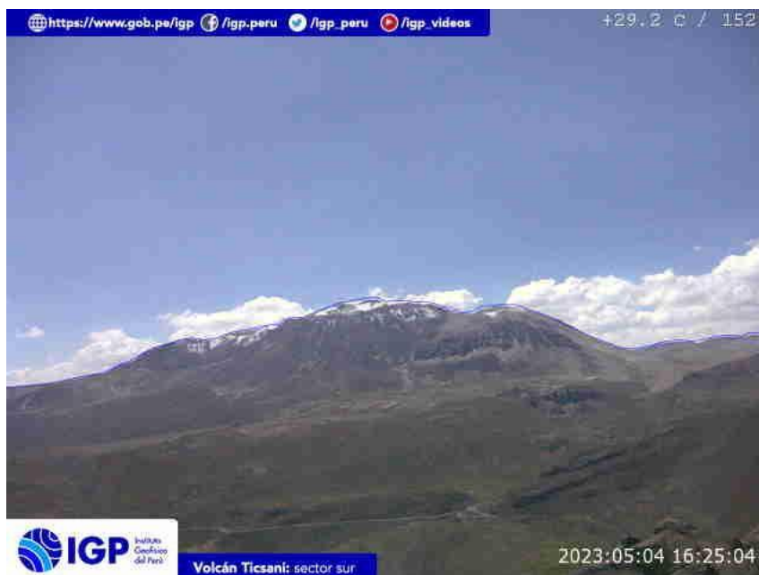
Figura 7.- Imagen de monitoreo de volcán Ticsani capturada por la cámara de monitoreo Ticsani, ubicada en el sector sur del volcán. La hora corresponde a formato UTC.