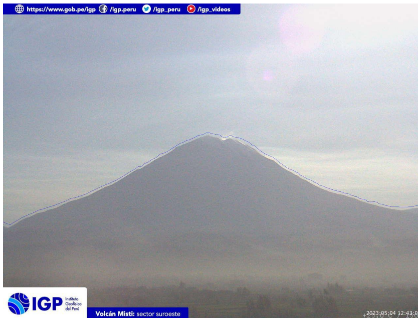
Figura 3.- Imagen de monitoreo del volcán Misti capturada por la cámara de monitoreo Misti 1, ubicada en el sector suroeste del volcán. La hora corresponde a formato UTC.