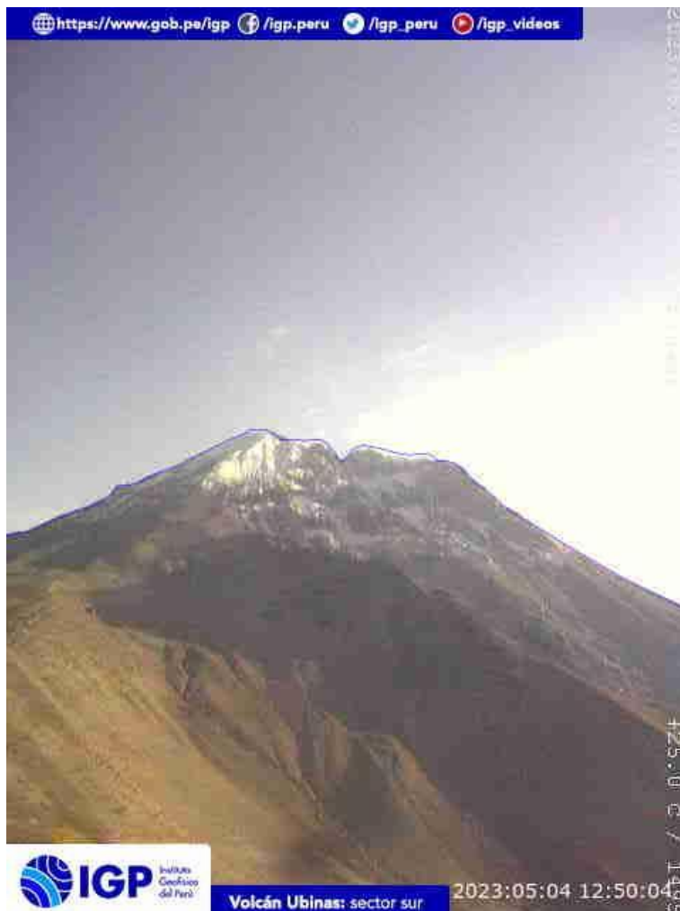
Figura 6.- Imagen de monitoreo del volcán Ubinas capturada por la cámara de monitoreo Ubinas2, ubicada en el sector sur del volcán. La hora corresponde a formato UTC.