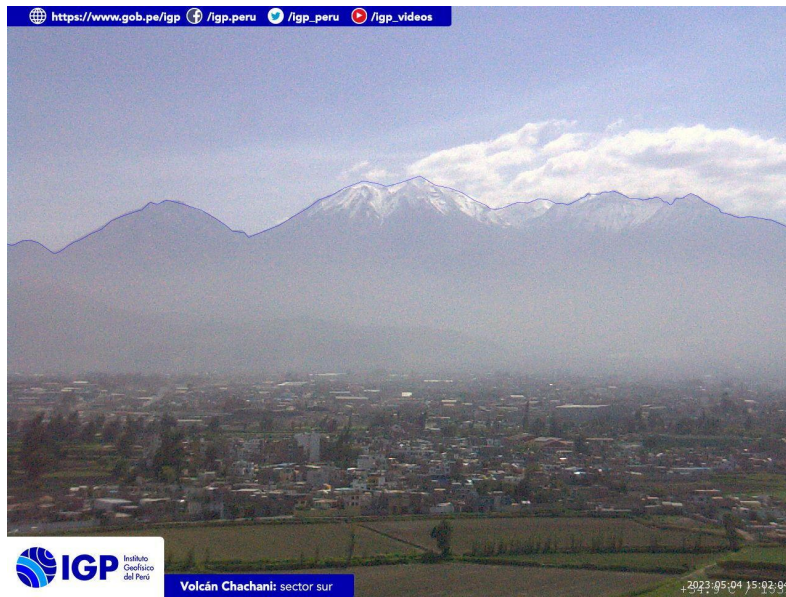
Figura 4.- Imagen de monitoreo del volcán Chachani capturada por la cámara de monitoreo Chachani 1, ubicada en el sector sur del volcán. La hora corresponde a formato UTC.