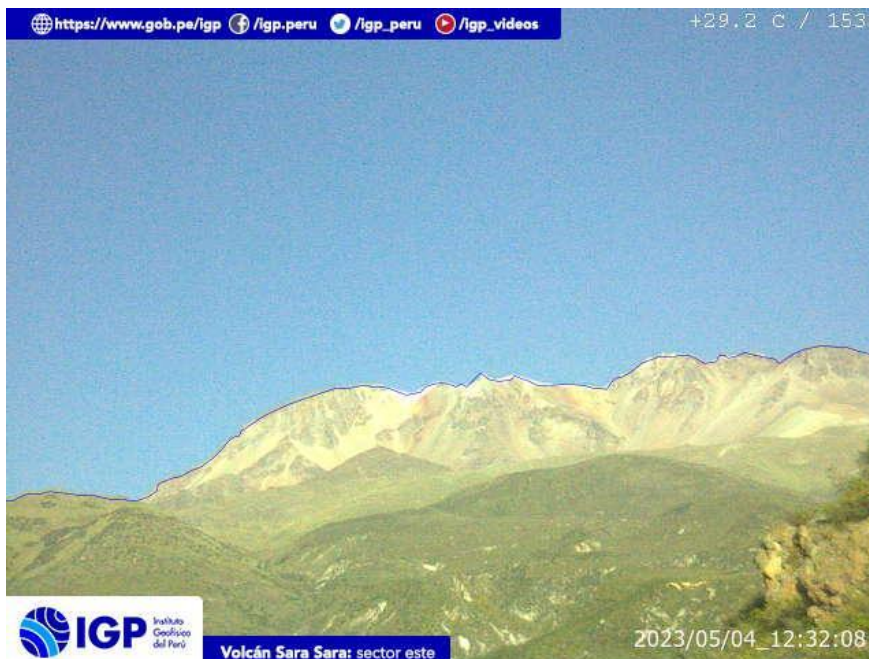
Figura 9.- Imagen de monitoreo del volcán Sara Sara capturada por la cámara de monitoreo Sara Sara, ubicada en el sector este del volcán. La hora corresponde a formato UTC.