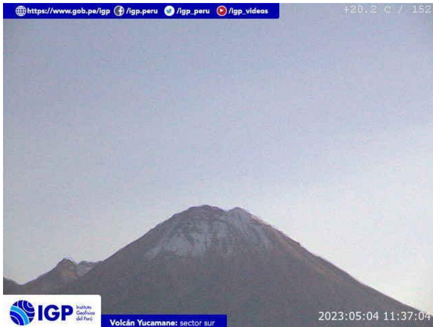
Figura 8.- Imagen de monitoreo del volcán Yucamane capturada por la cámara de monitoreo Yucamane, ubicada en el sector sur del volcán. La hora corresponde a formato UTC.