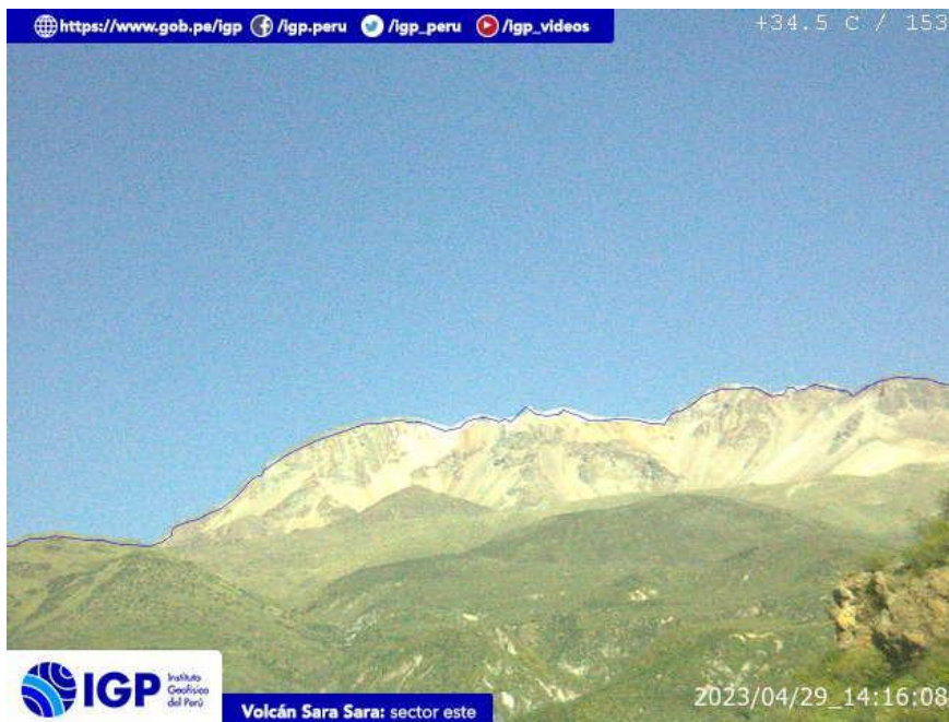
Figura 9.- Imagen de monitoreo del volcán Sara Sara capturada por la cámara de monitoreo Sara Sara, ubicada en el sector este del volcán. La hora corresponde a formato UTC.