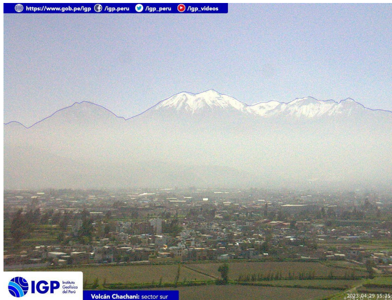
Figura 4.- Imagen de monitoreo del volcán Chachani capturada por la cámara de monitoreo Chachani 1, ubicada en el sector sur del volcán. La hora corresponde a formato UTC.