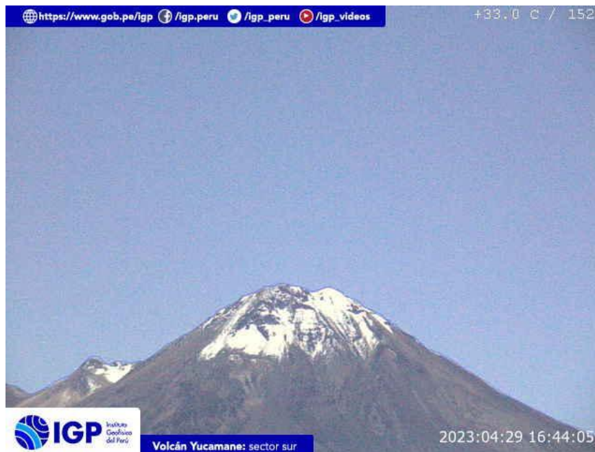
Figura 8.- Imagen de monitoreo del volcán Yucamane capturada por la cámara de monitoreo Yucamane, ubicada en el sector sur del volcán. La hora corresponde a formato UTC.