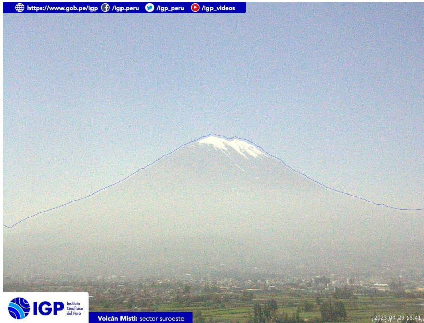
Figura 3.- Imagen de monitoreo del volcán Misti capturada por la cámara de monitoreo Misti 1, ubicada en el sector suroeste del volcán. La hora corresponde a formato UTC.