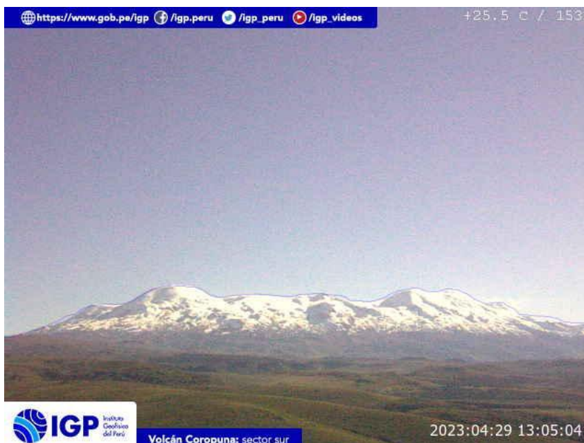
Figura 5.- Imagen de monitoreo del volcán Coropuna capturada por la cámara de monitoreo Coropuna 1, ubicada en el sector sur del volcán. La hora corresponde a formato UTC.