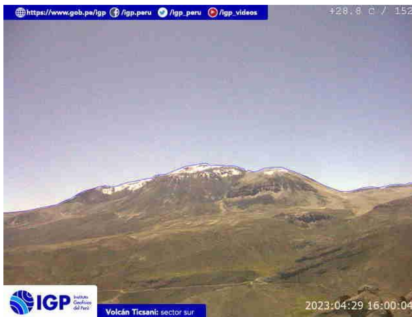
Figura 7.- Imagen de monitoreo del volcán Ticsani capturada por la cámara de monitoreo Ticsani, ubicada en el sector sur del volcán. La hora corresponde a formato UTC.