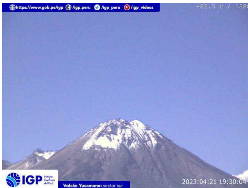
Figura 8.- Imagen de monitoreo del volcán Yucamane capturada por la cámara de monitoreo Yucamane, ubicada en el sector sur del volcán. La hora corresponde a formato UTC.