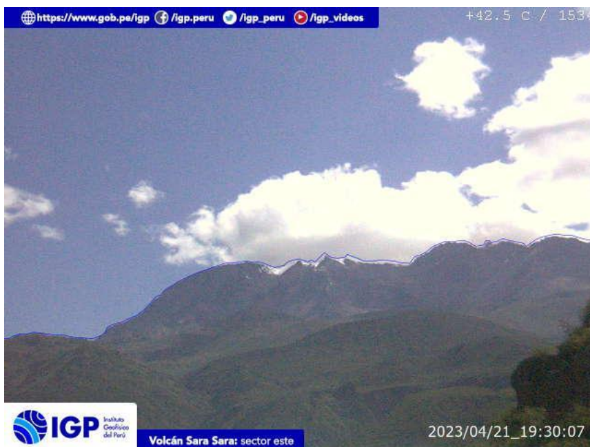
Figura 9.- Imagen de monitoreo del volcán Sara Sara capturada por la cámara de monitoreo Sara Sara, ubicada en el sector este del volcán. La hora corresponde a formato UTC.