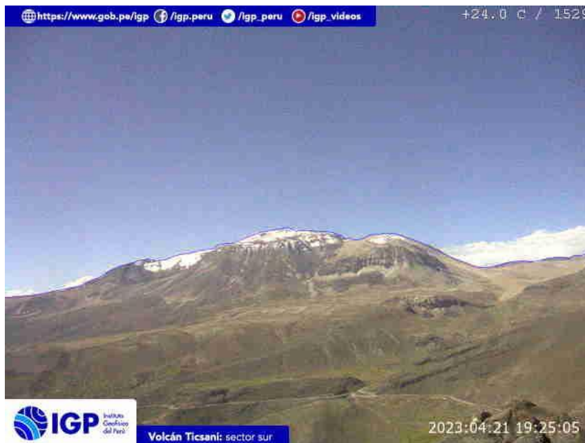
Figura 7.- Imagen de monitoreo del volcán Ticsani capturada por la cámara de monitoreo Ticsani, ubicada en el sector sur del volcán. La hora corresponde a formato UTC.