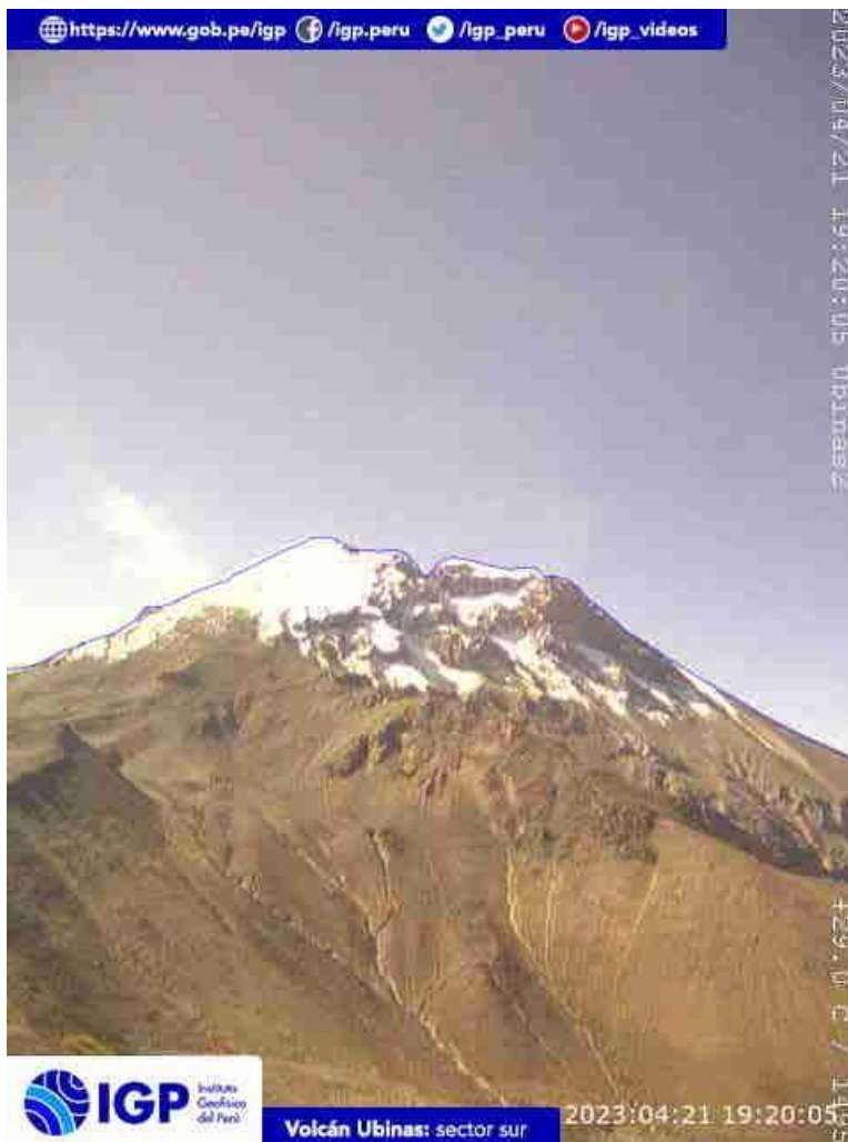
Figura 6.- Imagen de monitoreo del volcán Ubinas capturada por la cámara de monitoreo Ubinas1, ubicada en el sector oeste del volcán. La hora corresponde a formato UTC.