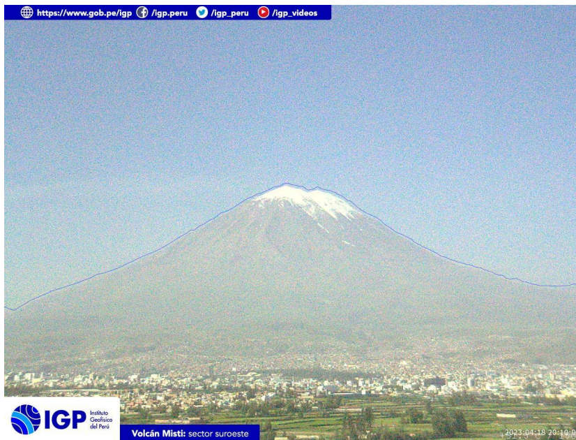
Figura 3.- Imagen de monitoreo del volcán Misti capturada por la cámara de monitoreo Misti 1, ubicada en el sector suroeste del volcán. La hora corresponde a formato UTC.