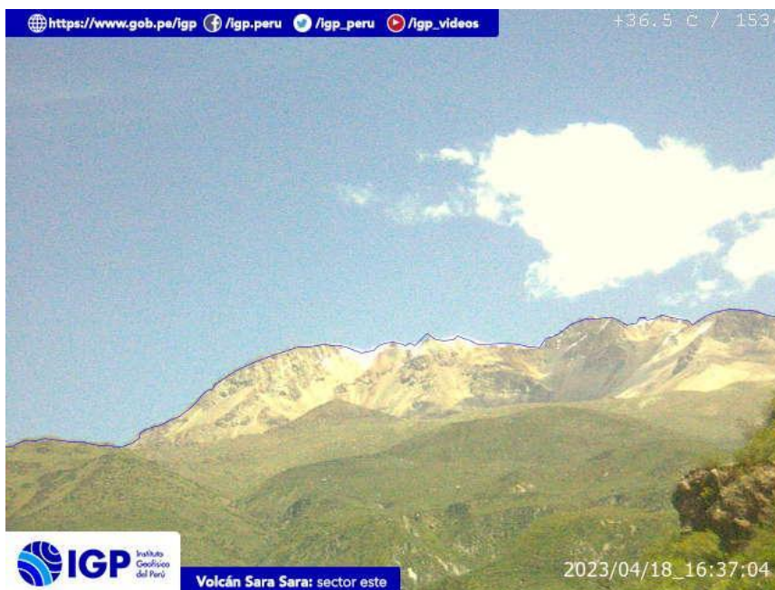
Figura 9.- Imagen de monitoreo del volcán Sara Sara capturada por la cámara de monitoreo Sara Sara, ubicada en el sector este del volcán. La hora corresponde a formato UTC.