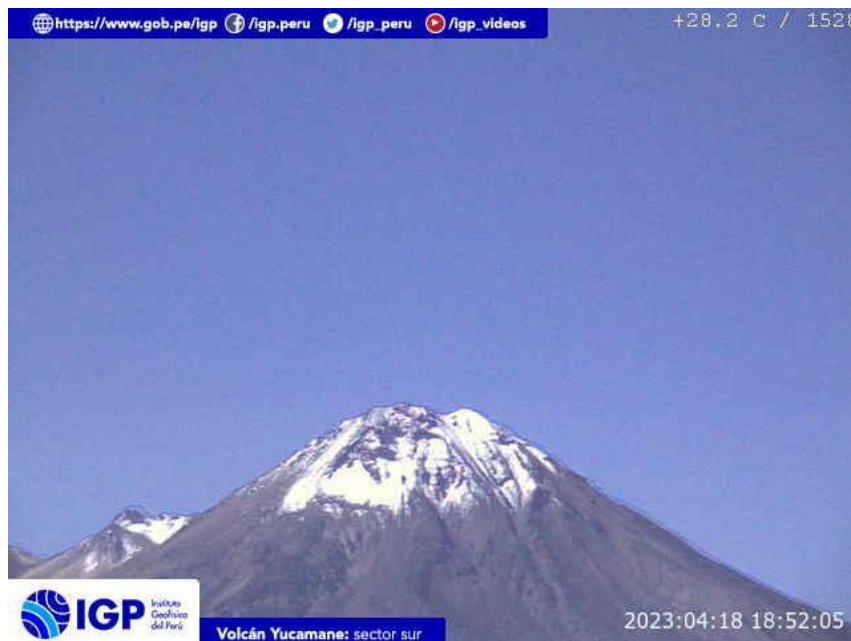
Figura 8.- Imagen de monitoreo del volcán Yucamane capturada por la cámara de monitoreo Yucamane, ubicada en el sector sur del volcán. La hora corresponde a formato UTC.