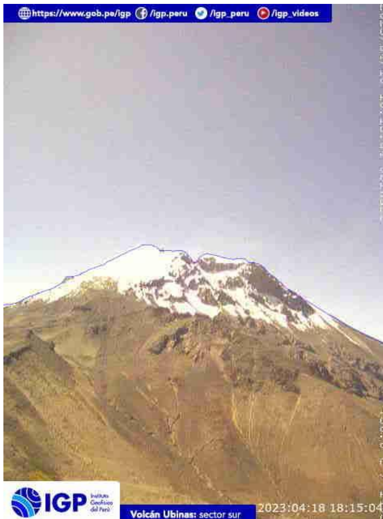
Figura 6.- Imagen de monitoreo del volcán Ubinas capturada por la cámara de monitoreo Ubinas1, ubicada en el sector oeste del volcán. La hora corresponde a formato UTC.