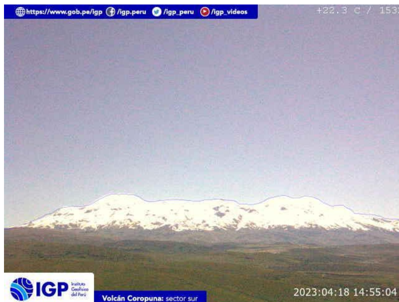
Figura 5.- Imagen de monitoreo del volcán Coropuna capturada por la cámara de monitoreo Coropuna 1, ubicada en el sector sur del volcán. La hora corresponde a formato UTC.