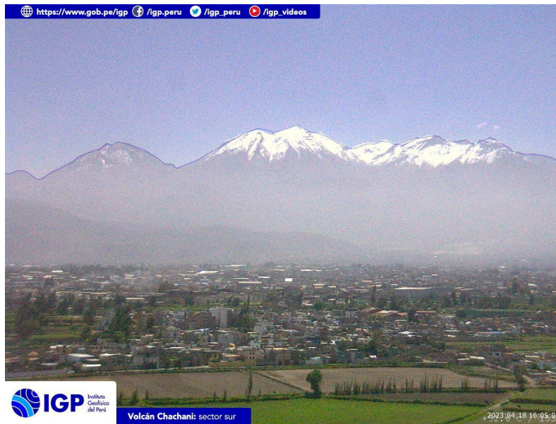
Figura 4.- Imagen de monitoreo del volcán Chachani capturada por la cámara de monitoreo Chachani 1, ubicada en el sector sur del volcán. La hora corresponde a formato UTC.