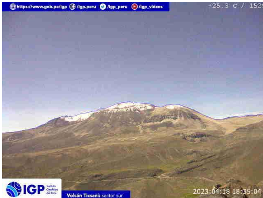
Figura 7.- Imagen de monitoreo del volcán Ticsani capturada por la cámara de monitoreo Ticsani, ubicada en el sector sur del volcán. La hora corresponde a formato UTC.