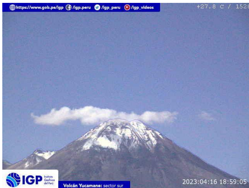
Figura 8.- Imagen de monitoreo del volcán Yucamane capturada por la cámara de monitoreo Yucamane, ubicada en el sector sur del volcán. La hora corresponde a formato UTC.