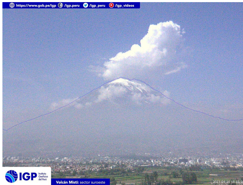
Figura 3.- Imagen de monitoreo del volcán Misti capturada por la cámara de monitoreo Misti 1, ubicada en el sector suroeste del volcán. La hora corresponde a formato UTC.