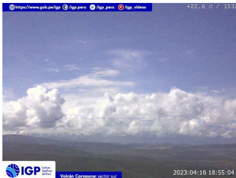
Figura 5.- Imagen de monitoreo del volcán Coropuna capturada por la cámara de monitoreo Coropuna 1, ubicada en el sector sur del volcán. La hora corresponde a formato UTC.