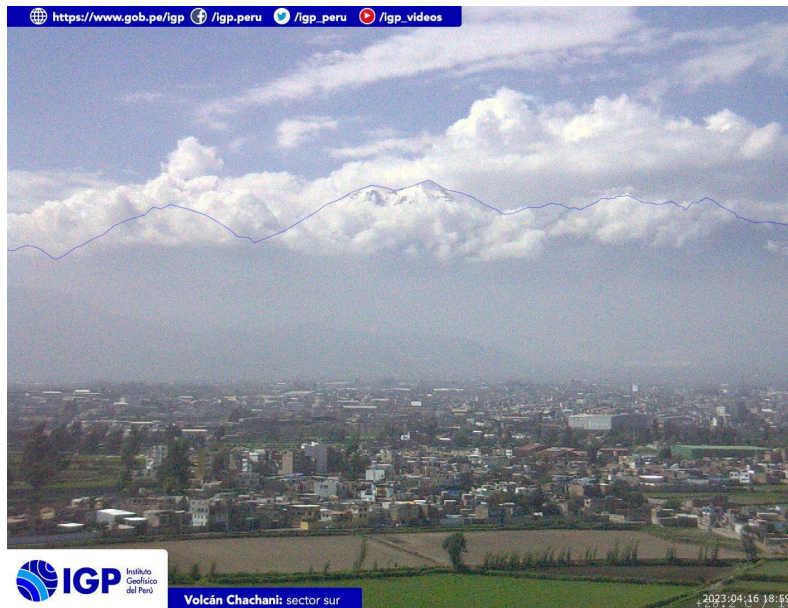
Figura 4.- Imagen de monitoreo del volcán Chachani capturada por la cámara de monitoreo Chachani 1, ubicada en el sector sur del volcán. La hora corresponde a formato UTC.