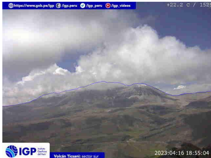
Figura 7.- Imagen de monitoreo del volcán Ticsani capturada por la cámara de monitoreo Ticsani, ubicada en el sector sur del volcán. La hora corresponde a formato UTC.