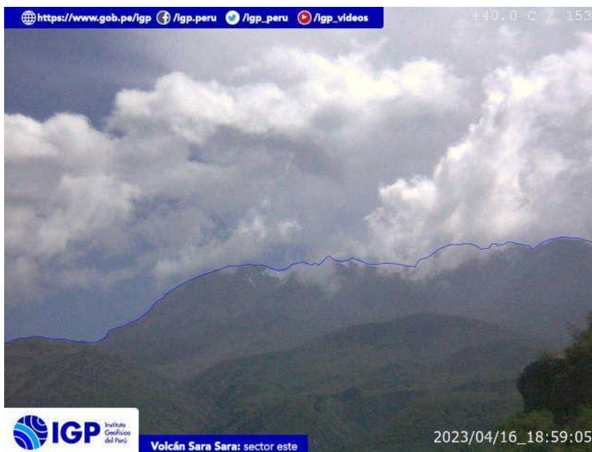
Figura 9.- Imagen de monitoreo del volcán Sara Sara capturada por la cámara de monitoreo Sara Sara, ubicada en el sector este del volcán. La hora corresponde a formato UTC.