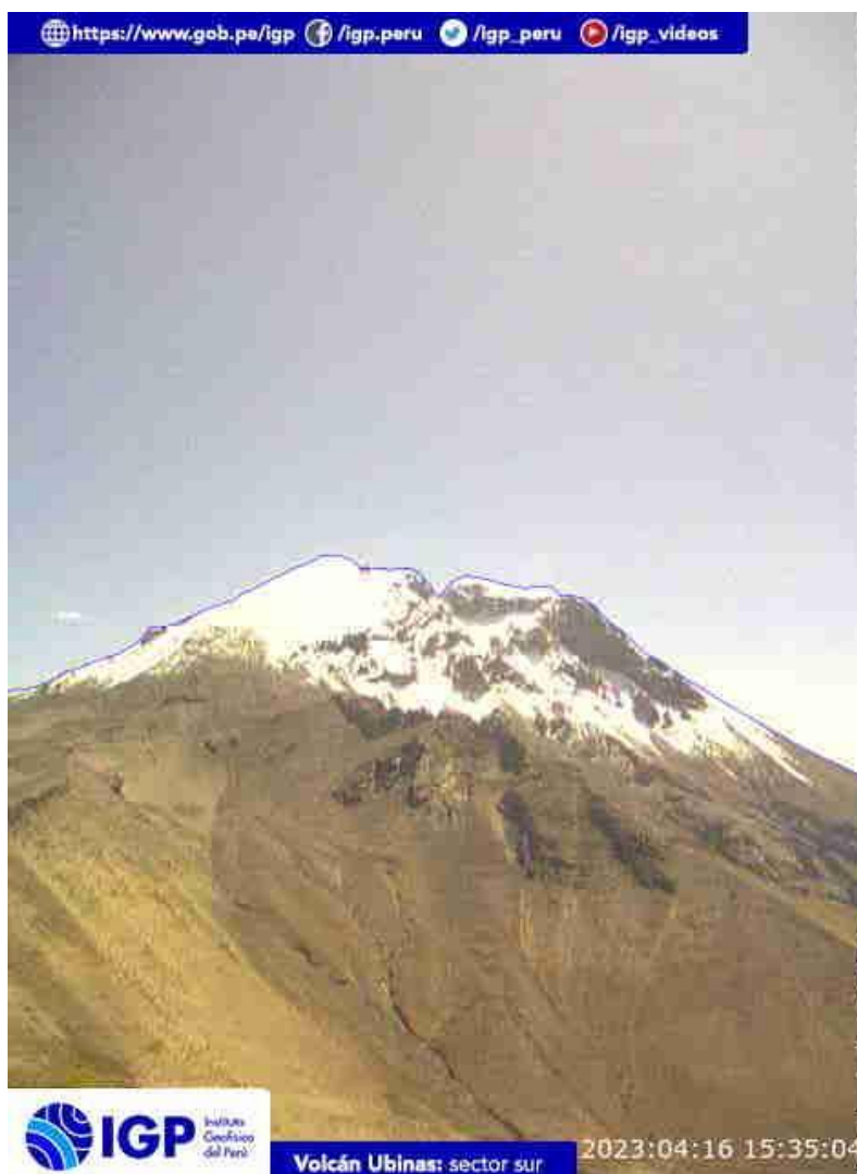
Figura 6.- Imagen de monitoreo del volcán Ubinas capturada por la cámara de monitoreo Ubinas2, ubicada en el sector sur del volcán. La hora corresponde a formato UTC.