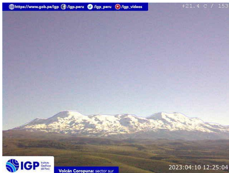
Figura 5.- Imagen de monitoreo del volcán Coropuna capturada por la cámara de monitoreo Coropuna 1, ubicada en el sector sur del volcán. La hora corresponde a formato UTC.