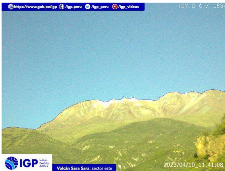
Figura 9.- Imagen de monitoreo del volcán Sara Sara capturada por la cámara de monitoreo Sara Sara, ubicada en el sector este del volcán. La hora corresponde a formato UTC.