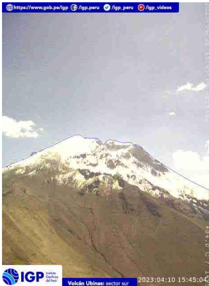
Figura 6.- Imagen de monitoreo del volcán Ubinas capturada por la cámara de monitoreo Ubinas2, ubicada en el sector sur del volcán. La hora corresponde a formato UTC.