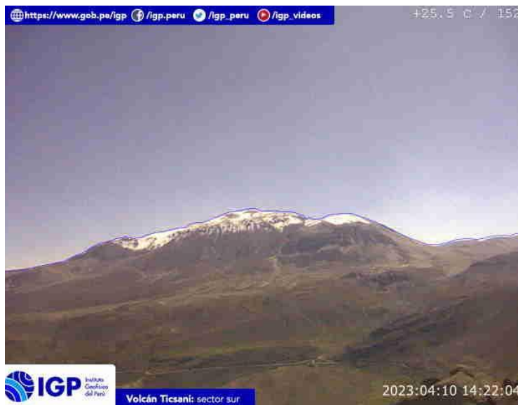
Figura 7.- Imagen de monitoreo del volcán Ticsani capturada por la cámara de monitoreo Ticsani, ubicada en el sector sur del volcán. La hora corresponde a formato UTC.