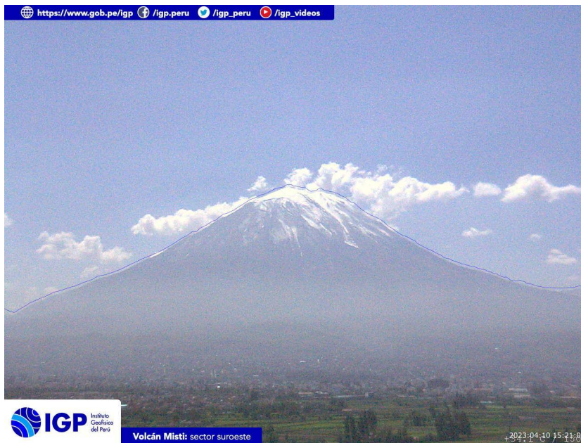
Figura 3.- Imagen de monitoreo del volcán Misti capturada por la cámara de monitoreo Misti 1, ubicada en el sector suroeste del volcán. La hora corresponde a formato UTC.