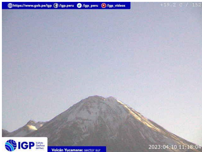
Figura 8.- Imagen de monitoreo del volcán Yucamane capturada por la cámara de monitoreo Yucamane, ubicada en el sector sur del volcán. La hora corresponde a formato UTC.