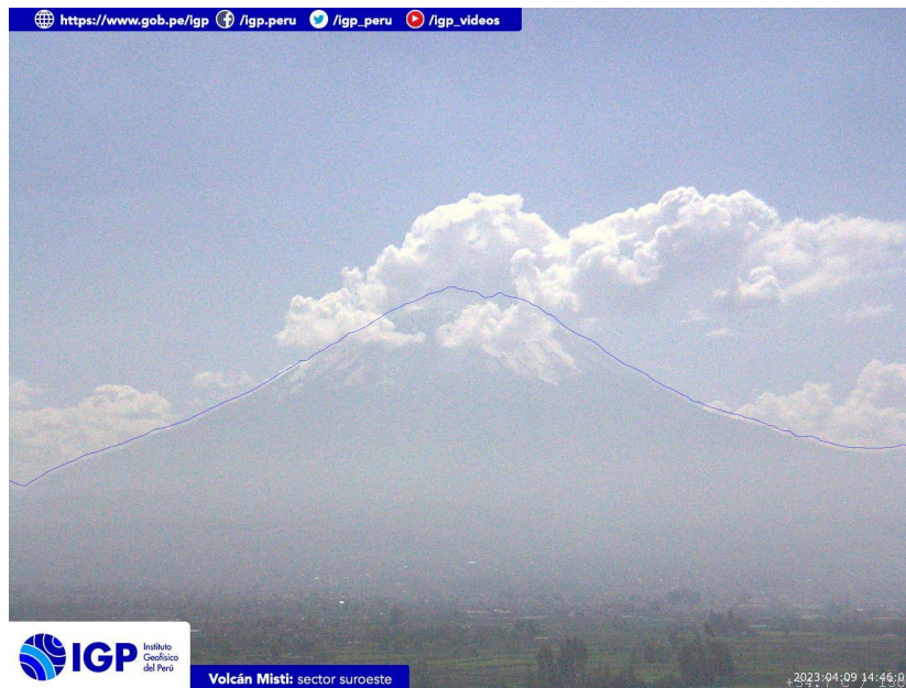
Figura 3.- Imagen de monitoreo del volcán Misti capturada por la cámara de monitoreo Misti 1, ubicada en el sector suroeste del volcán. La hora corresponde a formato UTC.