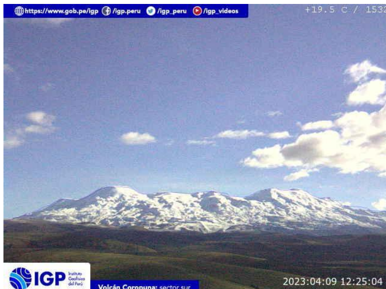
Figura 5.- Imagen de monitoreo del volcán Coropuna capturada por la cámara de monitoreo Coropuna 1, ubicada en el sector sur del volcán. La hora corresponde a formato UTC.