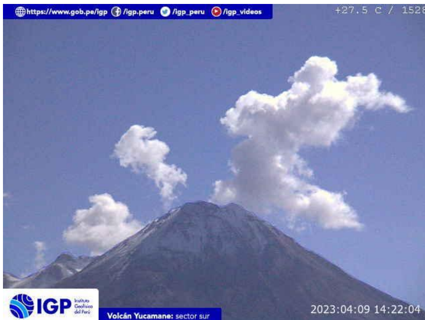
Figura 7.- Imagen de monitoreo del volcán Yucamane capturada por la cámara de monitoreo Yucamane, ubicada en el sector sur del volcán. La hora corresponde a formato UTC.