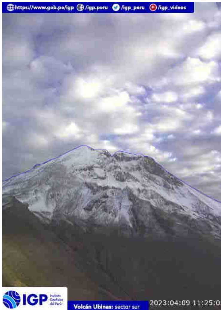
Figura 6.- Imagen de monitoreo del volcán Ubinas capturada por la cámara de monitoreo Ubinas2, ubicada en el sector sur del volcán. La hora corresponde a formato UTC.