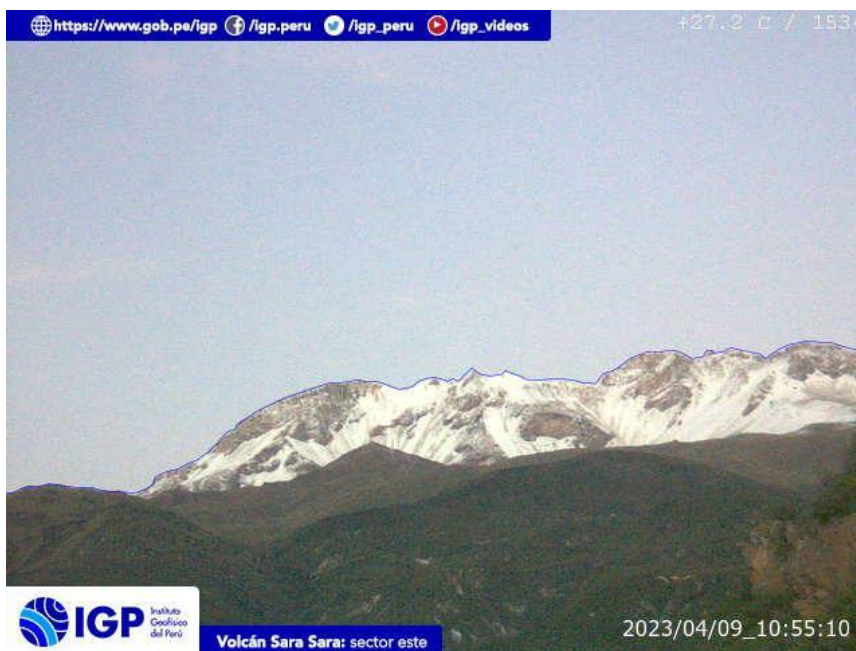
Figura 8.- Imagen de monitoreo del volcán Sara Sara capturada por la cámara de monitoreo Sara Sara, ubicada en el sector este del volcán. La hora corresponde a formato UTC.