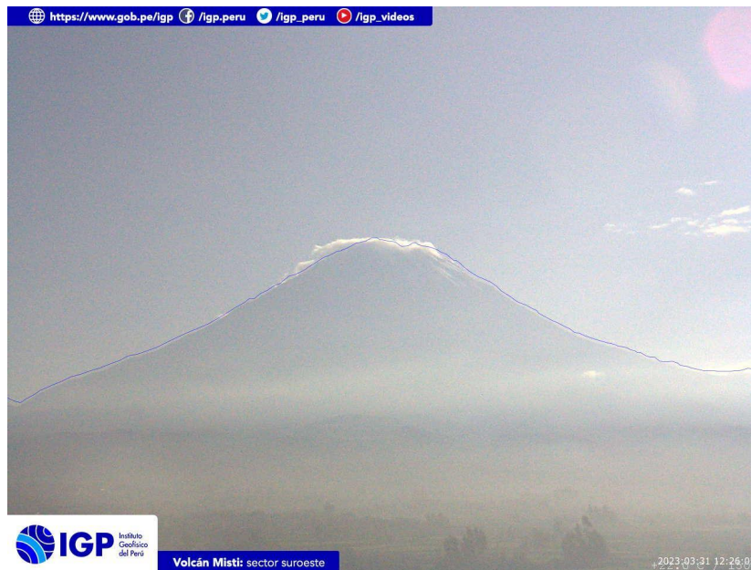
Figura 3.- Imagen de monitoreo del volcán Misti capturada por la cámara de monitoreo Misti 1, ubicada en el sector suroeste del volcán. La hora corresponde a formato UTC.