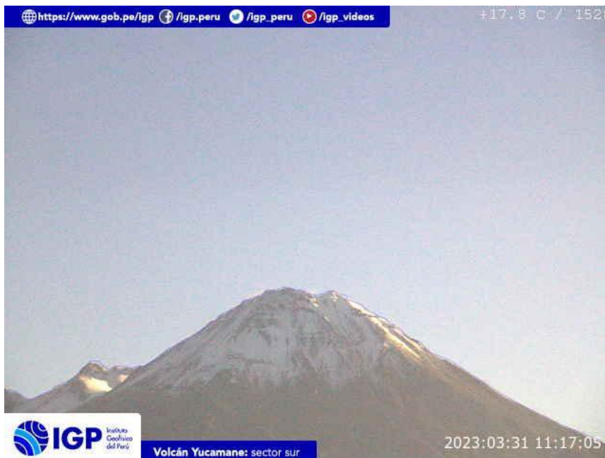
Figura 7.- Imagen de monitoreo del volcán Yucamane capturada por la cámara de monitoreo Yucamane, ubicada en el sector sur del volcán. La hora corresponde a formato UTC.