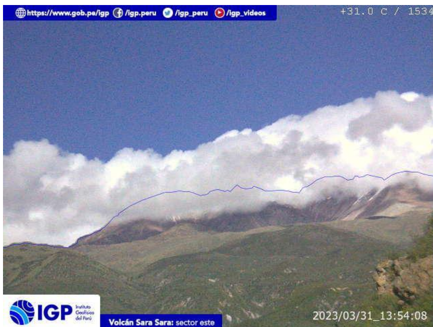
Figura 8.- Imagen de monitoreo del volcán Sara Sara capturada por la cámara de monitoreo Sara Sara, ubicada en el sector este del volcán. La hora corresponde a formato UTC.