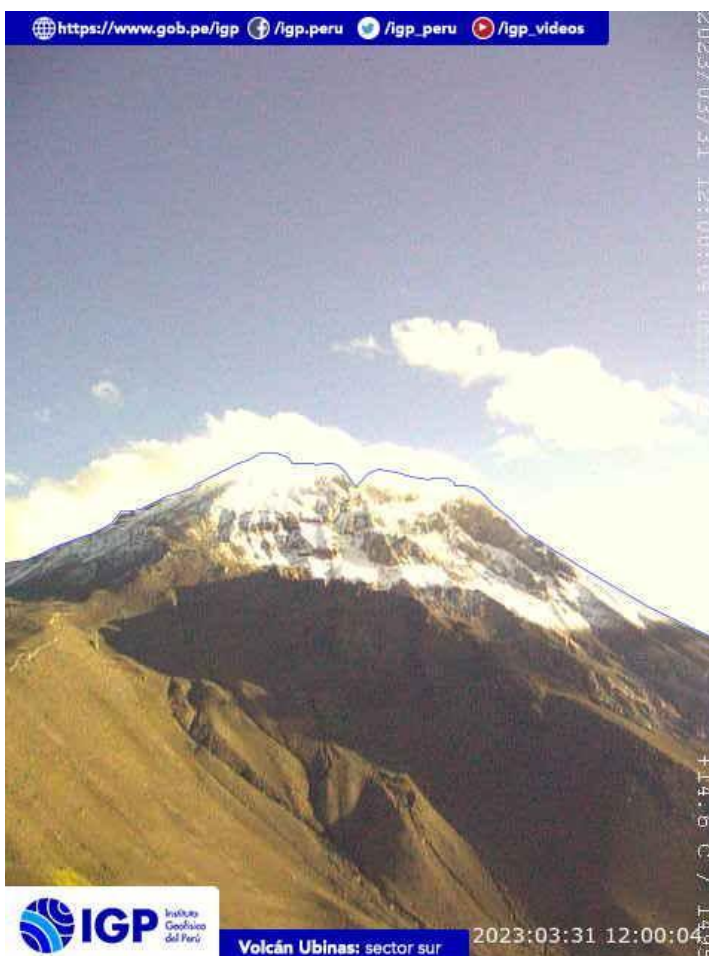
Figura 6.- Imagen de monitoreo del volcán Ubinas capturada por la cámara de monitoreo Ubinas2, ubicada en el sector sur del volcán. La hora corresponde a formato UTC.