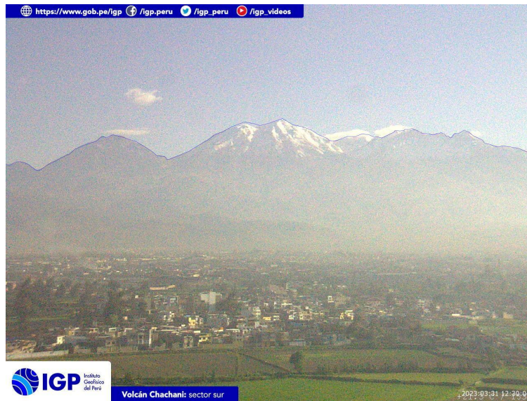
Figura 4.- Imagen de monitoreo del volcán Chachani capturada por la cámara de monitoreo Chachani 1, ubicada en el sector sur del volcán. La hora corresponde a formato UTC.