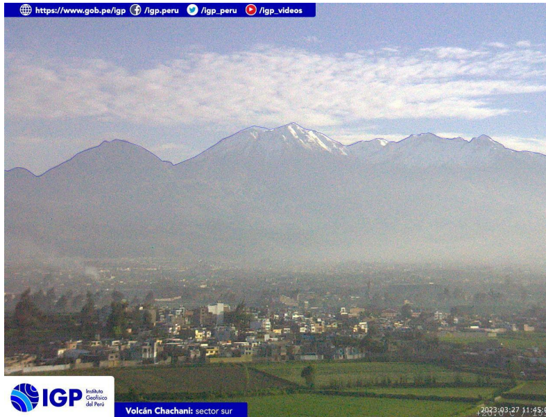
Figura 4.- Imagen de monitoreo del volcán Chachani capturada por la cámara de monitoreo Chachani 1, ubicada en el sector sur del volcán. La hora corresponde a formato UTC.