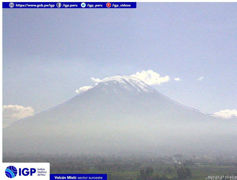
Figura 3.- Imagen de monitoreo del volcán Misti capturada por la cámara de monitoreo Misti 1, ubicada en el sector suroeste del volcán. La hora corresponde a formato UTC.