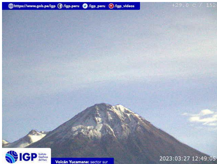
Figura 7.- Imagen de monitoreo del volcán Yucamane capturada por la cámara de monitoreo Yucamane, ubicada en el sector sur del volcán. La hora corresponde a formato UTC.