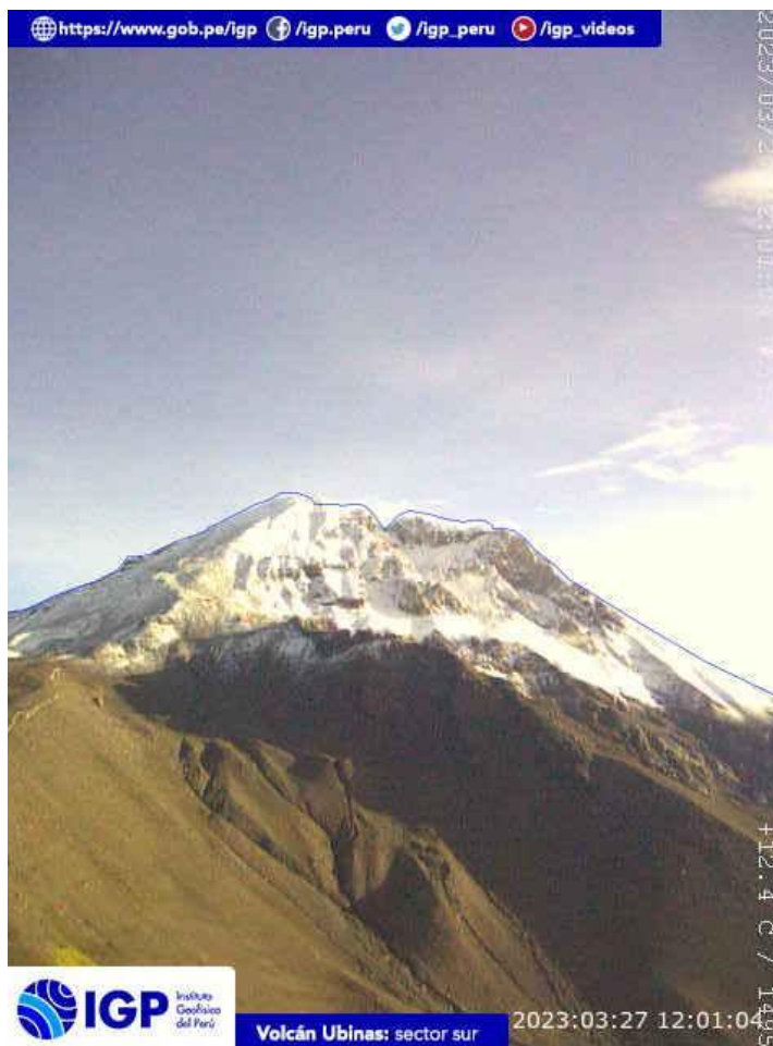
Figura 6.- Imagen de monitoreo del volcán Ubinas capturada por la cámara de monitoreo Ubinas1, ubicada en el sector oeste del volcán. La hora corresponde a formato UTC.