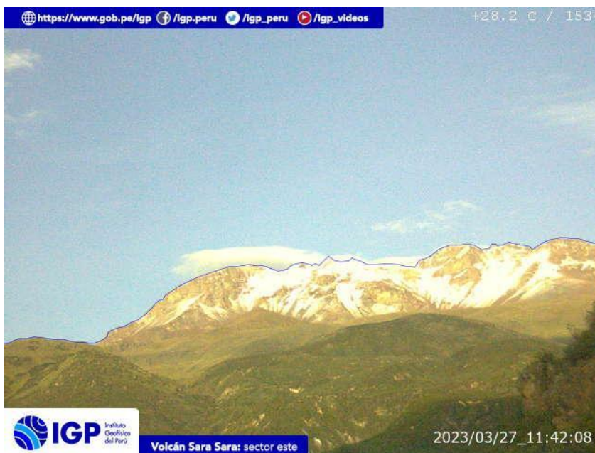
Figura 8.- Imagen de monitoreo del volcán Sara Sara capturada por la cámara de monitoreo Sara Sara, ubicada en el sector este del volcán. La hora corresponde a formato UTC.