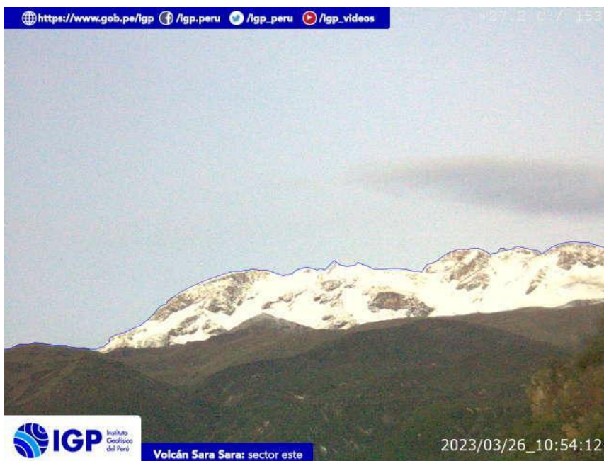
Figura 8.- Imagen de monitoreo del volcán Sara Sara capturada por la cámara de monitoreo Sara Sara, ubicada en el sector este del volcán. La hora corresponde a formato UTC.