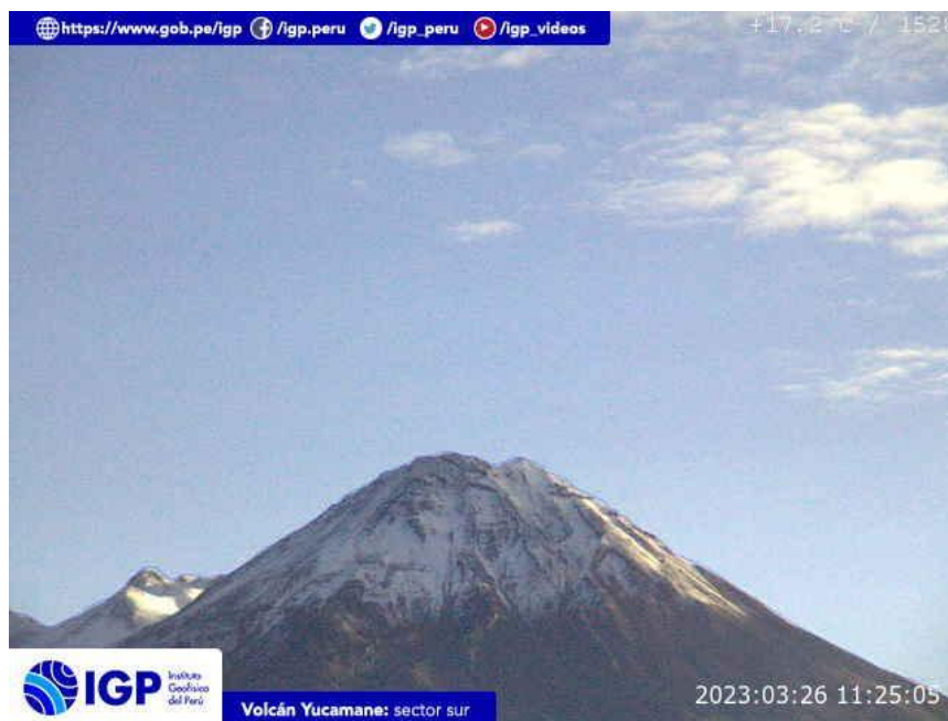
Figura 7.- Imagen de monitoreo del volcán Yucamane capturada por la cámara de monitoreo Yucamane, ubicada en el sector sur del volcán. La hora corresponde a formato UTC.