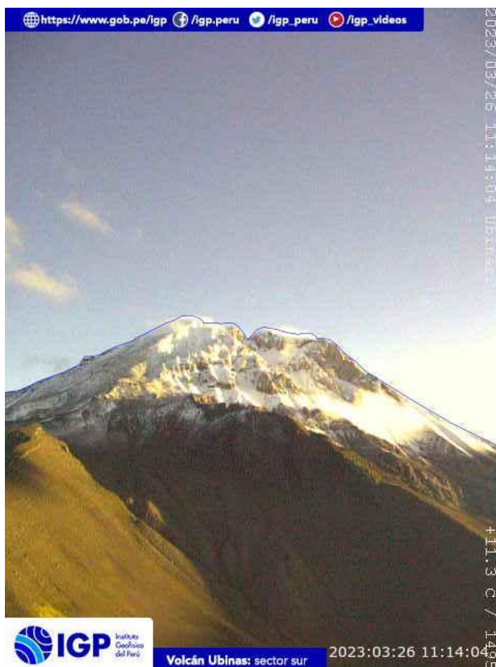
Figura 6.- Imagen de monitoreo del volcán Ubinas capturada por la cámara de monitoreo Ubinas1, ubicada en el sector oeste del volcán. La hora corresponde a formato UTC.