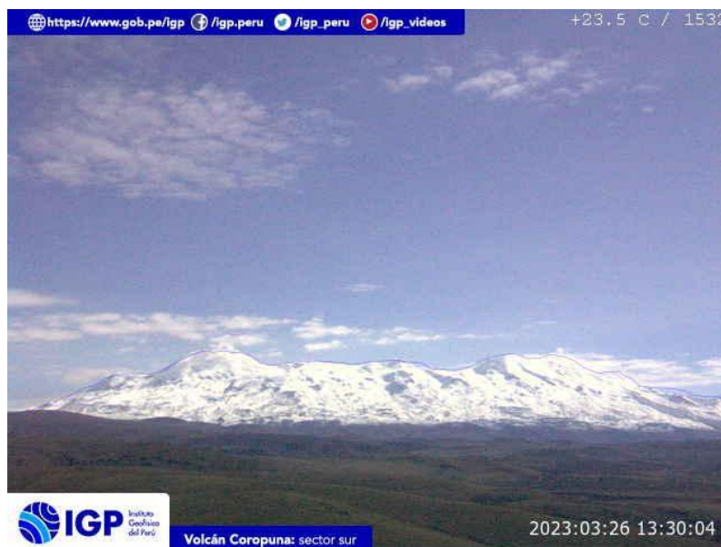
Figura 5.- Imagen de monitoreo del volcán Coropuna capturada por la cámara de monitoreo Coropuna 1, ubicada en el sector sur del volcán. La hora corresponde a formato UTC.