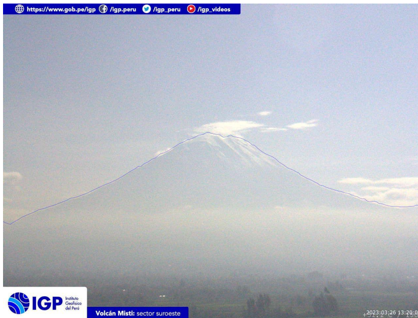
Figura 3.- Imagen de monitoreo del volcán Misti capturada por la cámara de monitoreo Misti 1, ubicada en el sector suroeste del volcán. La hora corresponde a formato UTC.