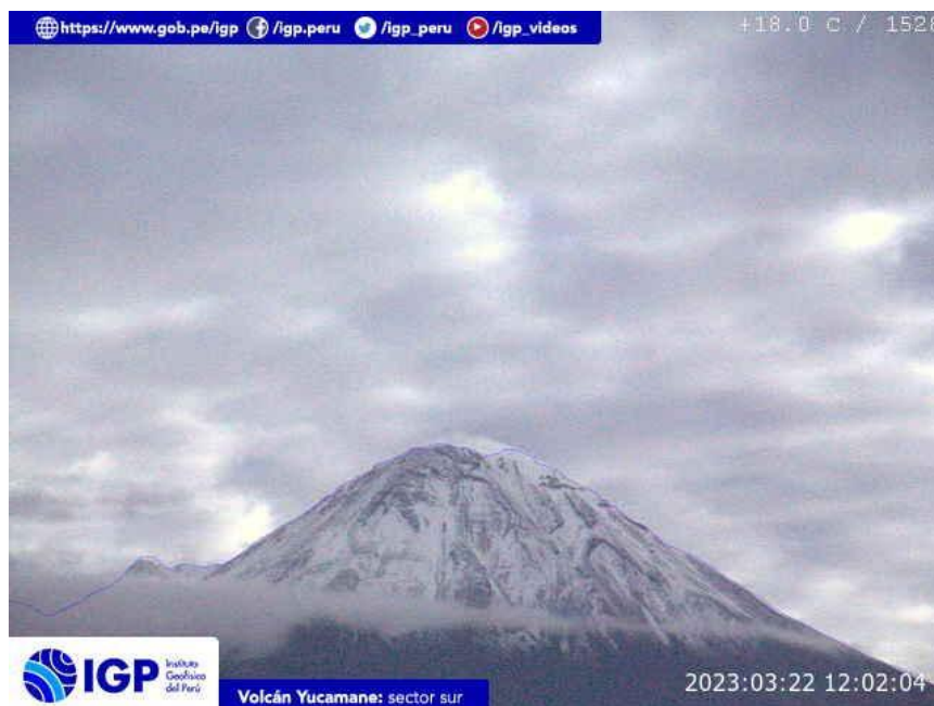
Figura 7.- Imagen de monitoreo del volcán Yucamane capturada por la cámara de monitoreo Yucamane, ubicada en el sector sur del volcán. La hora corresponde a formato UTC.