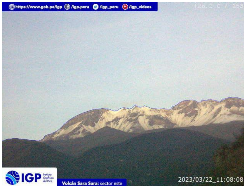
Figura 8.- Imagen de monitoreo del volcán Sara Sara capturada por la cámara de monitoreo Sara Sara, ubicada en el sector este del volcán. La hora corresponde a formato UTC.