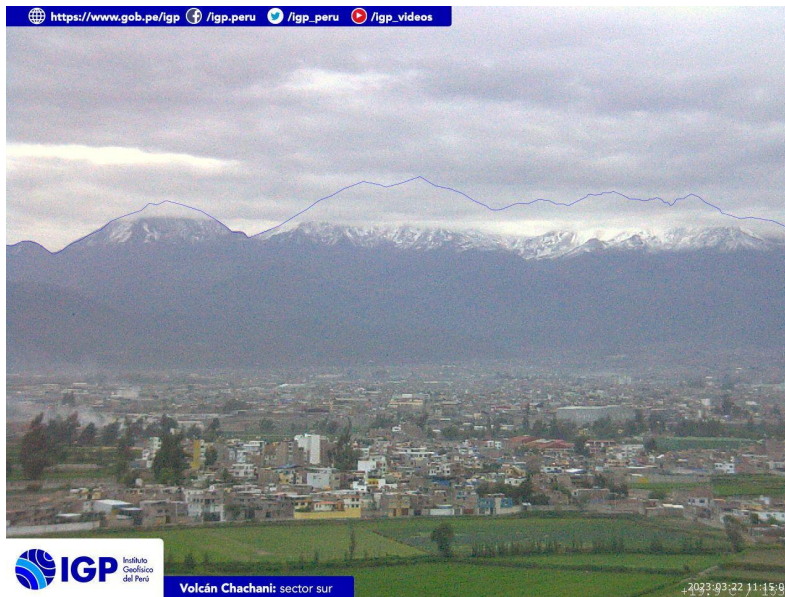
Figura 4.- Imagen de monitoreo del volcán Chachani capturada por la cámara de monitoreo Chachani 1, ubicada en el sector sur del volcán. La hora corresponde a formato UTC.