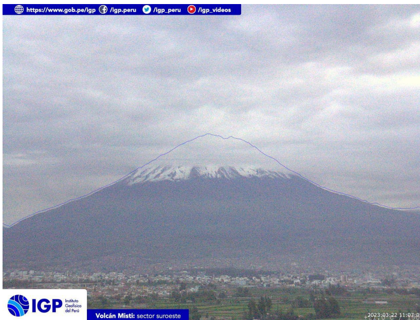
Figura 3.- Imagen de monitoreo del volcán Misti capturada por la cámara de monitoreo Misti 1, ubicada en el sector suroeste del volcán. La hora corresponde a formato UTC.