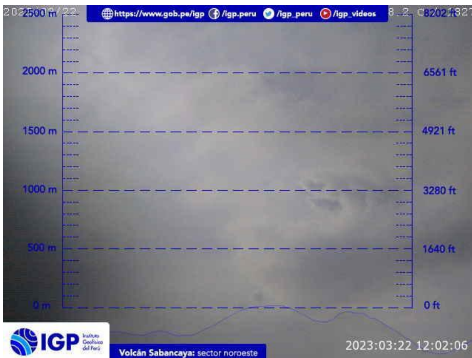
Figura 2.- Imagen de monitoreo del volcán Sabancaya capturada por la cámara de monitoreo Mucurca, ubicada en el sector noroeste del volcán. La hora corresponde a formato UTC.

Nivel de alerta volcánica actual: naranja .