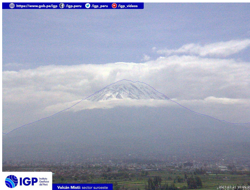
Figura 3.- Imagen de monitoreo del volcán Misti capturada por la cámara de monitoreo Misti 1, ubicada en el sector suroeste del volcán. La hora corresponde a formato UTC.