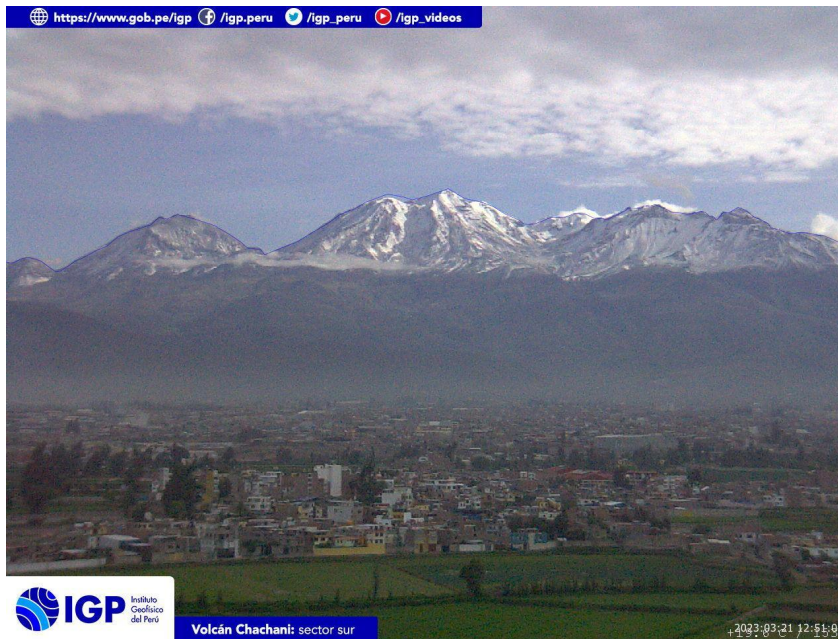
Figura 4.- Imagen de monitoreo del volcán Chachani capturada por la cámara de monitoreo Chachani 1, ubicada en el sector sur del volcán. La hora corresponde a formato UTC.