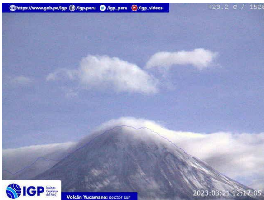
Figura 7.- Imagen de monitoreo del volcán Yucamane capturada por la cámara de monitoreo Yucamane, ubicada en el sector sur del volcán. La hora corresponde a formato UTC.