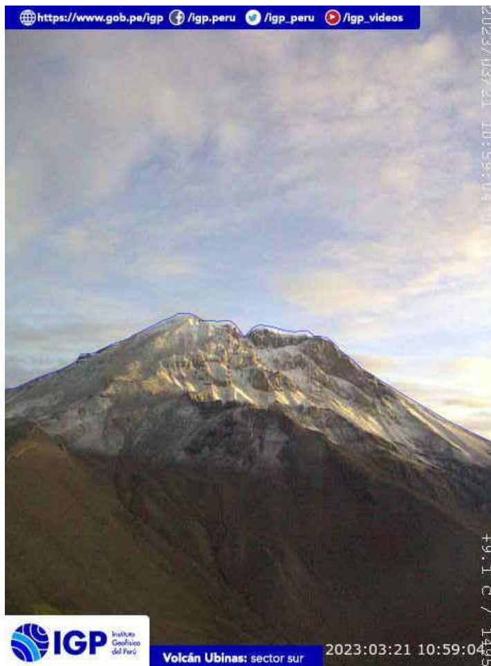
Figura 6.- Imagen de monitoreo del volcán Ubinas capturada por la cámara de monitoreo Ubinas1, ubicada en el sector oeste del volcán. La hora corresponde a formato UTC.