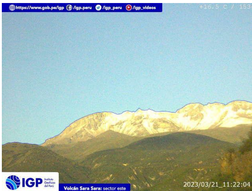
Figura 8.- Imagen de monitoreo del volcán Sara Sara capturada por la cámara de monitoreo Sara Sara, ubicada en el sector este del volcán. La hora corresponde a formato UTC.