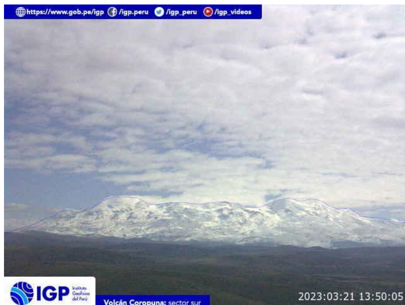
Figura 5.- Imagen de monitoreo del volcán Coropuna capturada por la cámara de monitoreo Coropuna 1, ubicada en el sector sur del volcán. La hora corresponde a formato UTC.