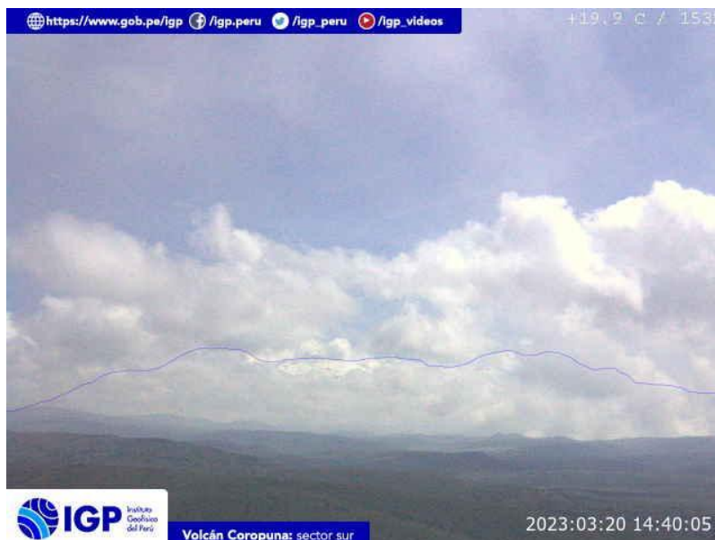
Figura 5.- Imagen de monitoreo del volcán Coropuna capturada por la cámara de monitoreo Coropuna 1, ubicada en el sector sur del volcán. La hora corresponde a formato UTC.