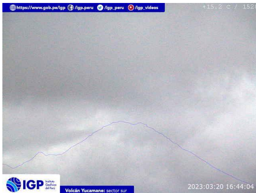
Figura 7.- Imagen de monitoreo del volcán Yucamane capturada por la cámara de monitoreo Yucamane, ubicada en el sector sur del volcán. La hora corresponde a formato UTC.