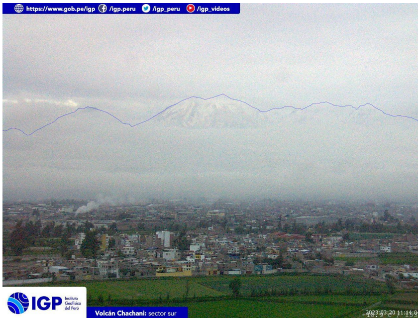
Figura 4.- Imagen de monitoreo del volcán Chachani capturada por la cámara de monitoreo Chachani 1, ubicada en el sector sur del volcán. La hora corresponde a formato UTC.