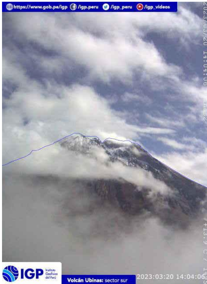
Figura 6.- Imagen de monitoreo del volcán Ubinas capturada por la cámara de monitoreo Ubinas1, ubicada en el sector oeste del volcán. La hora corresponde a formato UTC.