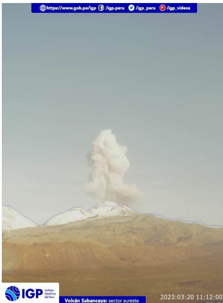
Figura 2.- Imagen de monitoreo del volcán Sabancaya capturada por la cámara de monitoreo Cajamarcana, ubicada en el sector sureste del volcán. La hora corresponde a formato UTC.

Nivel de alerta volcánica actual: naranja .