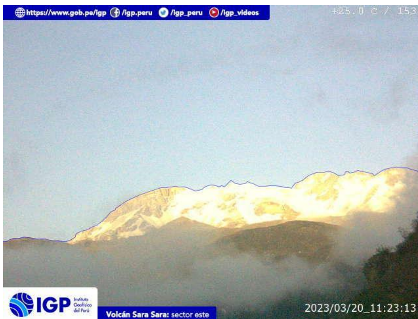
Figura 8.- Imagen de monitoreo del volcán Sara Sara capturada por la cámara de monitoreo Sara Sara, ubicada en el sector este del volcán. La hora corresponde a formato UTC.