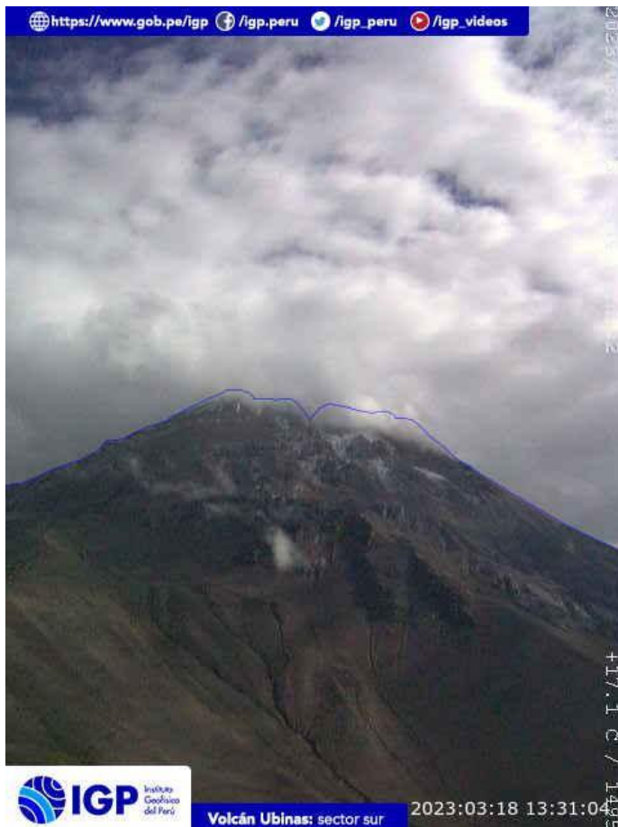
Figura 6.- Imagen de monitoreo del volcán Ubinas capturada por la cámara de monitoreo Ubinas1, ubicada en el sector oeste del volcán. La hora corresponde a formato UTC.