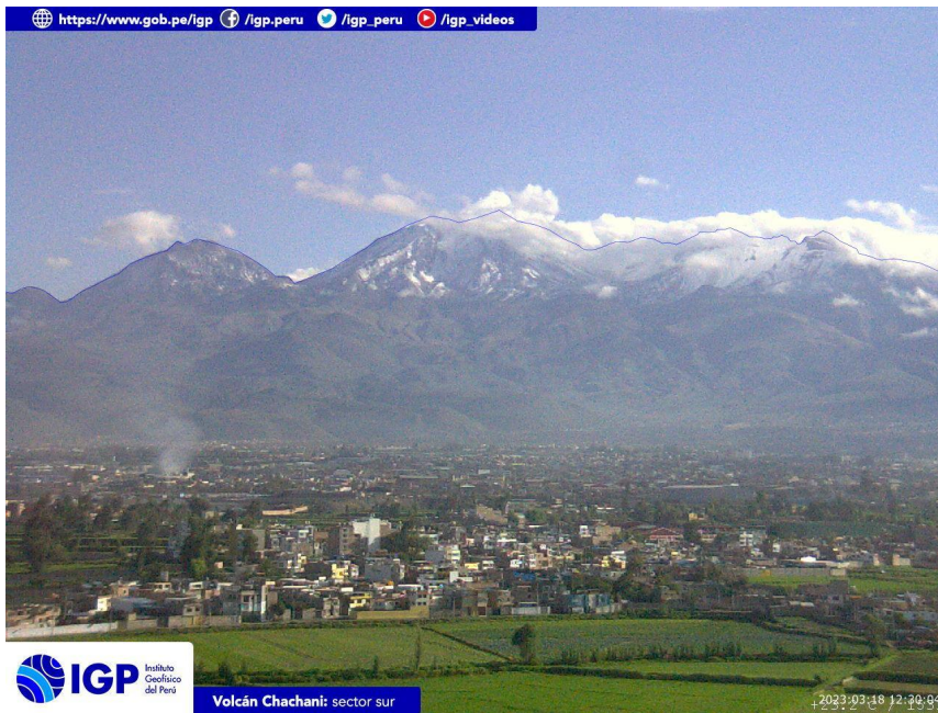
Figura 4.- Imagen de monitoreo del volcán Chachani capturada por la cámara de monitoreo Chachani 1, ubicada en el sector sur del volcán. La hora corresponde a formato UTC.