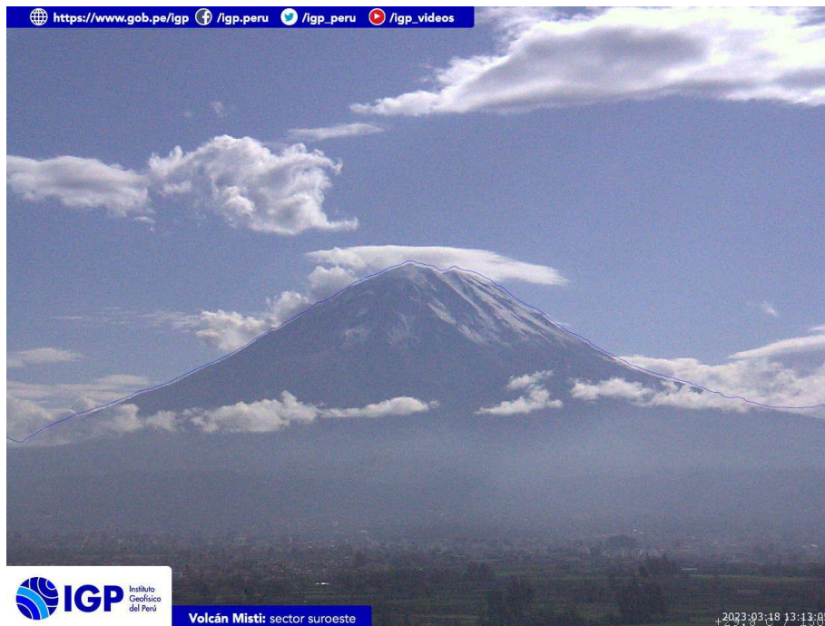
Figura 3.- Imagen de monitoreo del volcán Misti capturada por la cámara de monitoreo Misti 1, ubicada en el sector suroeste del volcán. La hora corresponde a formato UTC.