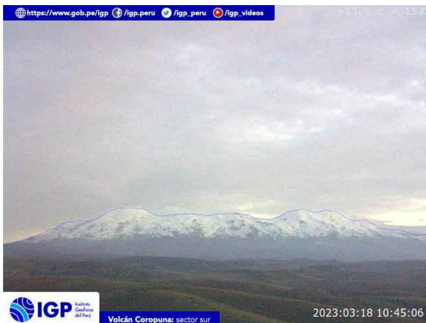
Figura 5.- Imagen de monitoreo del volcán Coropuna capturada por la cámara de monitoreo Coropuna 1, ubicada en el sector sur del volcán. La hora corresponde a formato UTC.