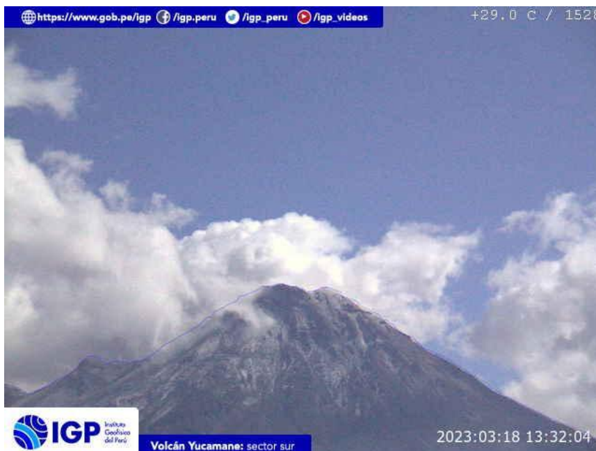
Figura 7.- Imagen de monitoreo del volcán Yucamane capturada por la cámara de monitoreo Yucamane, ubicada en el sector sur del volcán. La hora corresponde a formato UTC.