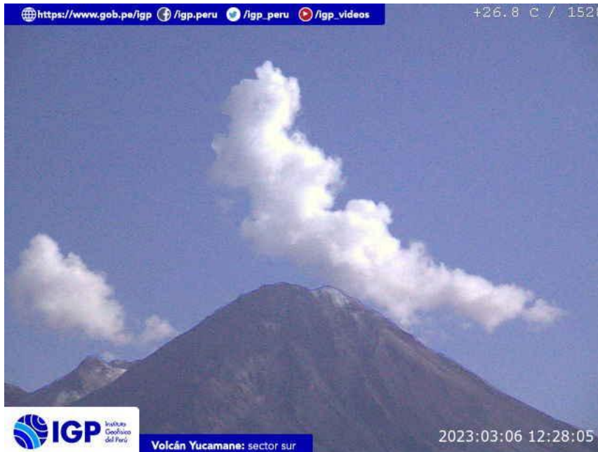
Figura 7.- Imagen de monitoreo del volcán Yucamane capturada por la cámara de monitoreo Yucamane, ubicada en el sector sur del volcán. La hora corresponde a formato UTC.