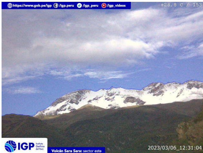
Figura 8.- Imagen de monitoreo del volcán Sara Sara capturada por la cámara de monitoreo Sara Sara, ubicada en el sector este del volcán. La hora corresponde a formato UTC.