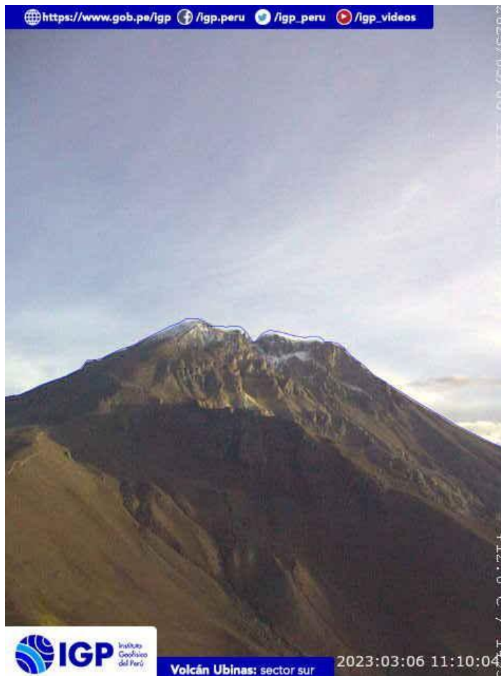
Figura 6.- Imagen de monitoreo del volcán Ubinas capturada por la cámara de monitoreo Ubinas2, ubicada en el sector sur del volcán. La hora corresponde a formato UTC.