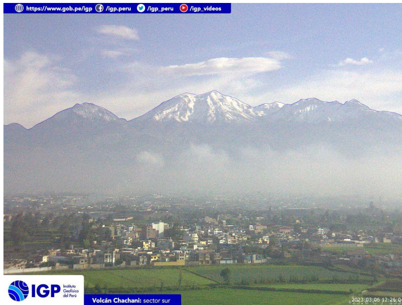
Figura 4.- Imagen de monitoreo del volcán Chachani capturada por la cámara de monitoreo Chachani 1, ubicada en el sector sur del volcán. La hora corresponde a formato UTC.