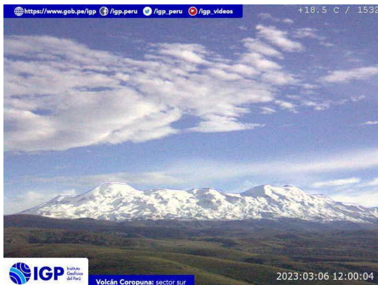
Figura 5.- Imagen de monitoreo del volcán Coropuna capturada por la cámara de monitoreo Coropuna 1, ubicada en el sector sur del volcán. La hora corresponde a formato UTC.