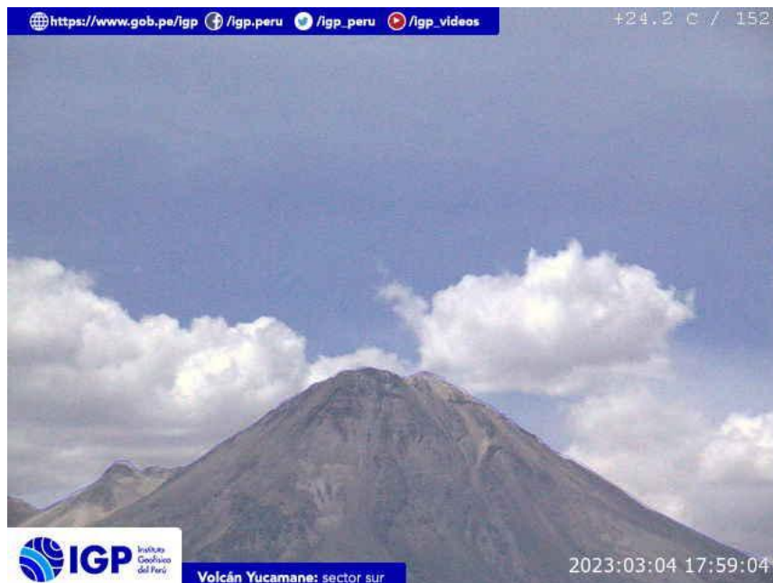
Figura 7.- Imagen de monitoreo del volcán Yucamane capturada por la cámara de monitoreo Yucamane, ubicada en el sector sur del volcán. La hora corresponde a formato UTC.