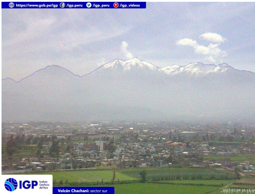
Figura 4.- Imagen de monitoreo del volcán Chachani capturada por la cámara de monitoreo Chachani 1, ubicada en el sector sur del volcán. La hora corresponde a formato UTC.