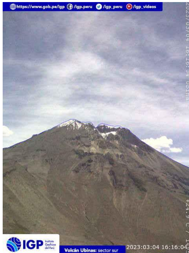
Figura 6.- Imagen de monitoreo del volcán Ubinas capturada por la cámara de monitoreo Ubinas2, ubicada en el sector sur del volcán. La hora corresponde a formato UTC.