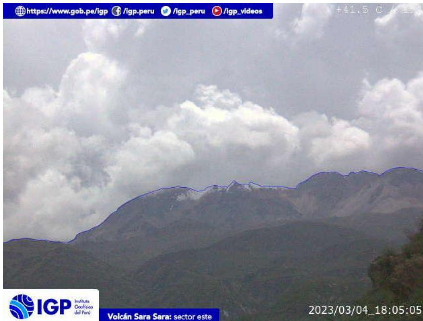
Figura 8.- Imagen de monitoreo del volcán Sara Sara capturada por la cámara de monitoreo Sara Sara, ubicada en el sector este del volcán. La hora corresponde a formato UTC.