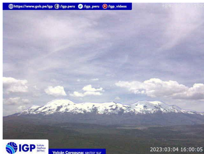
Figura 5.- Imagen de monitoreo del volcán Coropuna capturada por la cámara de monitoreo Coropuna 1, ubicada en el sector sur del volcán. La hora corresponde a formato UTC.