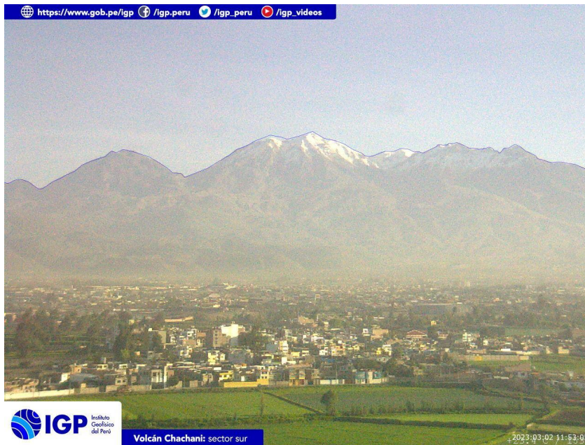
Figura 4.- Imagen de monitoreo del volcán Chachani capturada por la cámara de monitoreo Chachani 1, ubicada en el sector sur del volcán. La hora corresponde a formato UTC.