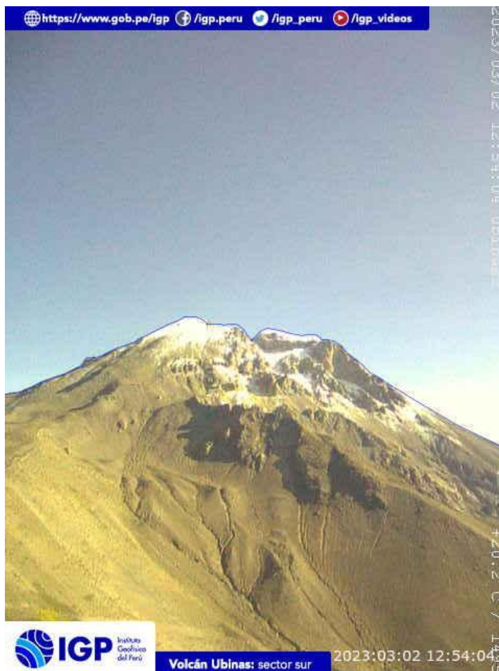
Figura 6.- Imagen de monitoreo del volcán Ubinas capturada por la cámara de monitoreo Ubinas2, ubicada en el sector sur del volcán. La hora corresponde a formato UTC.