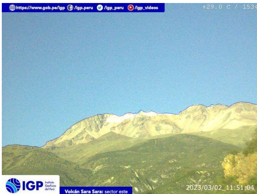
Figura 8.- Imagen de monitoreo del volcán Sara Sara capturada por la cámara de monitoreo Sara Sara, ubicada en el sector este del volcán. La hora corresponde a formato UTC.