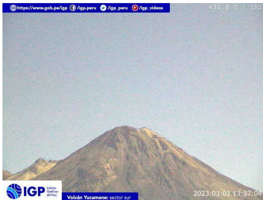
Figura 7.- Imagen de monitoreo del volcán Yucamane capturada por la cámara de monitoreo Yucamane, ubicada en el sector sur del volcán. La hora corresponde a formato UTC.