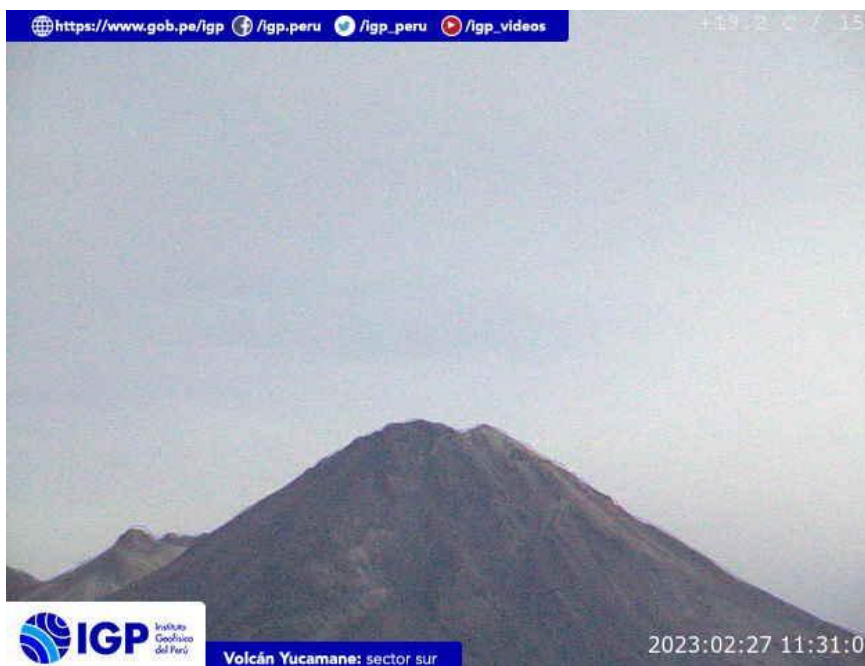
Figura 7.- Imagen de monitoreo del volcán Yucamane capturada por la cámara de monitoreo Yucamane, ubicada en el sector sur del volcán. La hora corresponde a formato UTC.