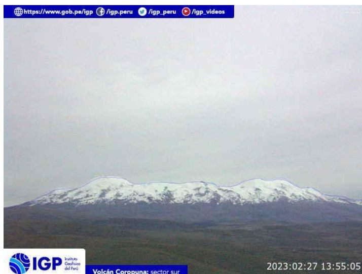
Figura 5.- Imagen de monitoreo del volcán Coropuna capturada por la cámara de monitoreo Coropuna 1, ubicada en el sector sur del volcán. La hora corresponde a formato UTC.