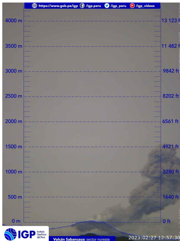
Figura 2.- Imagen de monitoreo del volcán Sabancaya capturada por la cámara de monitoreo Chivay, ubicada en el sector noreste del volcán. La hora corresponde a formato UTC.

Nivel de alerta volcánica actual: naranja .