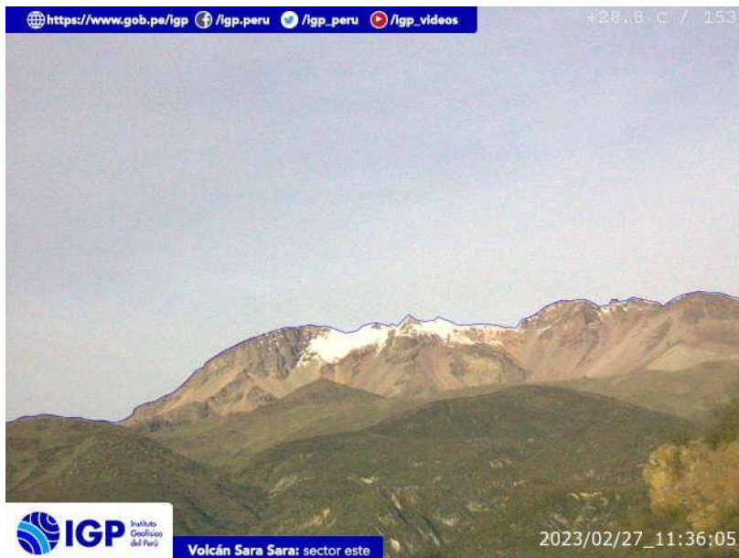
Figura 8.- Imagen de monitoreo del volcán Sara Sara capturada por la cámara de monitoreo Sara Sara, ubicada en el sector este del volcán. La hora corresponde a formato UTC.