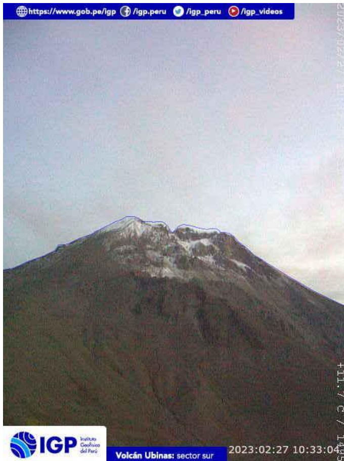
Figura 6.- Imagen de monitoreo del volcán Ubinas capturada por la cámara de monitoreo Ubinas2, ubicada en el sector sur del volcán. La hora corresponde a formato UTC.