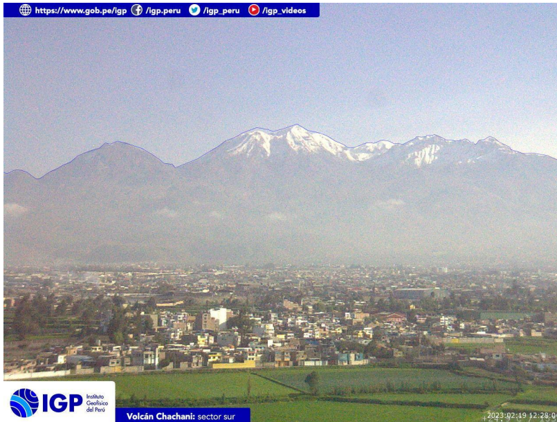
Figura 4.- Imagen de monitoreo del volcán Chachani capturada por la cámara de monitoreo Chachani 1, ubicada en el sector sur del volcán. La hora corresponde a formato UTC.