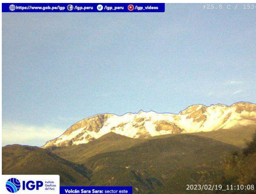
Figura 7.- Imagen de monitoreo del volcán Sara Sara capturada por la cámara de monitoreo Sara Sara, ubicada en el sector este del volcán. La hora corresponde a formato UTC.