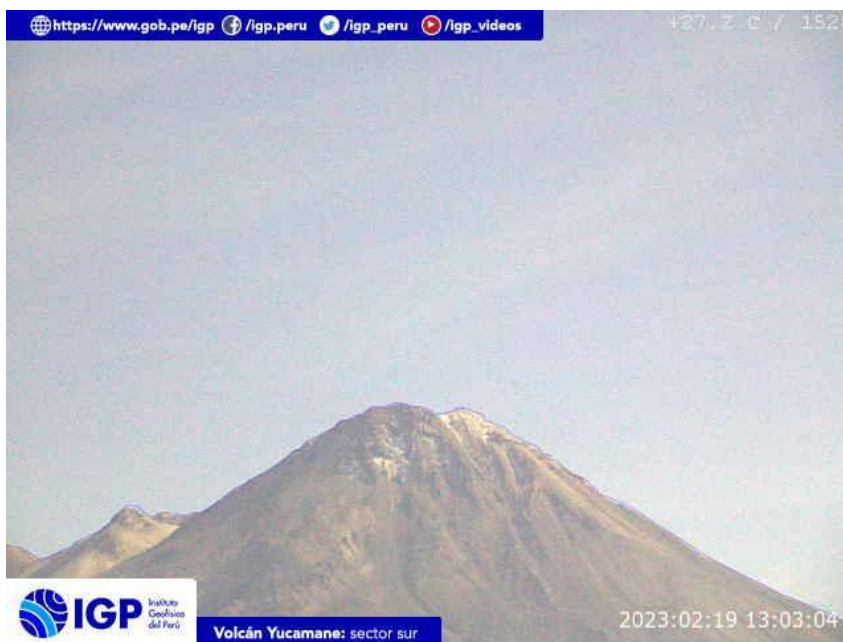
Figura 6.- Imagen de monitoreo del volcán Yucamane capturada por la cámara de monitoreo Yucamane, ubicada en el sector sur del volcán. La hora corresponde a formato UTC.