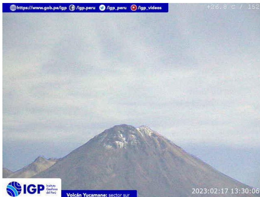
Figura 6.- Imagen de monitoreo del volcán Yucamane capturada por la cámara de monitoreo Yucamane, ubicada en el sector sur del volcán. La hora corresponde a formato UTC.