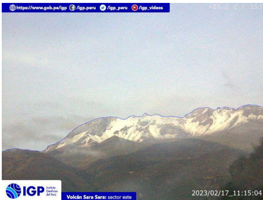
Figura 7.- Imagen de monitoreo del volcán Sara Sara capturada por la cámara de monitoreo Sara Sara, ubicada en el sector este del volcán. La hora corresponde a formato UTC.