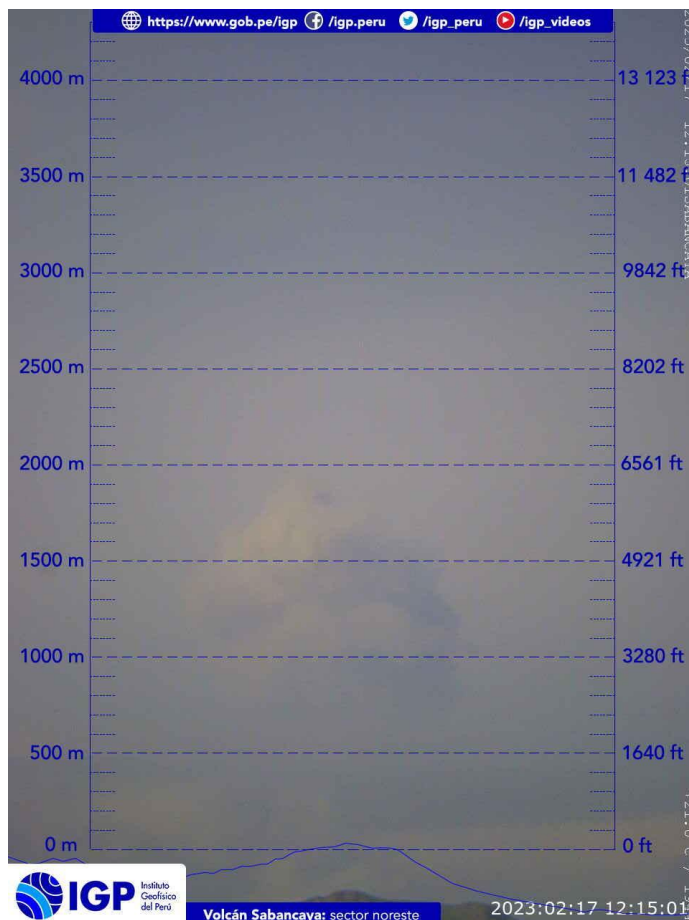
Figura 2.- Imagen de monitoreo del volcán Sabancaya capturada por la cámara de monitoreo Chivay, ubicada en el sector noreste del volcán. La hora corresponde a formato UTC.

Nivel de alerta volcánica actual: naranja .