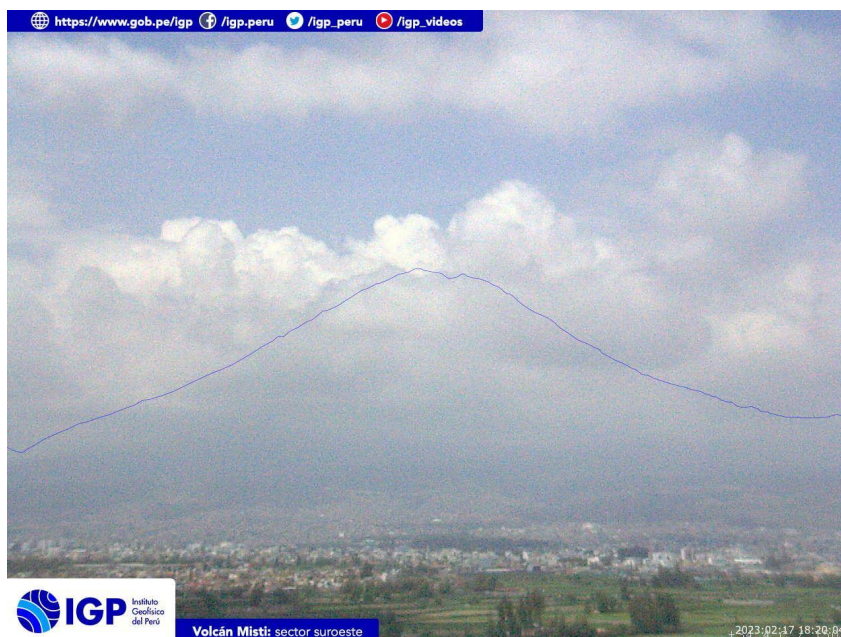
Figura 3.- Imagen de monitoreo del volcán Misti capturada por la cámara de monitoreo Misti 1, ubicada en el sector suroeste del volcán. La hora corresponde a formato UTC.