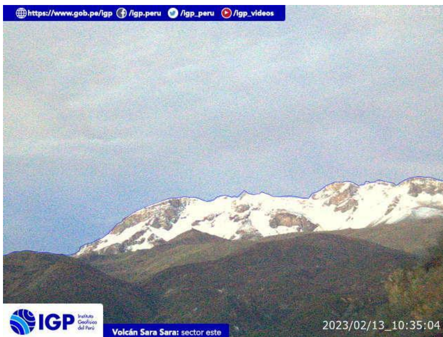
Figura 7.- Imagen de monitoreo del volcán Sara Sara capturada por la cámara de monitoreo Sara Sara, ubicada en el sector este del volcán. La hora corresponde a formato UTC.