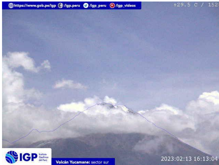
Figura 6.- Imagen de monitoreo del volcán Yucamane capturada por la cámara de monitoreo Yucamane, ubicada en el sector sur del volcán. La hora corresponde a formato UTC.