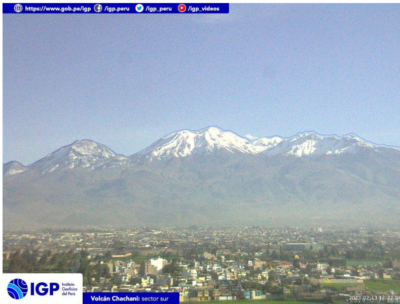
Figura 4.- Imagen de monitoreo del volcán Chachani capturada por la cámara de monitoreo Chachani 1, ubicada en el sector sur del volcán. La hora corresponde a formato UTC.