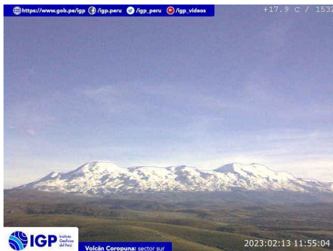
Figura 5.- Imagen de monitoreo del volcán Coropuna capturada por la cámara de monitoreo Coropuna 1, ubicada en el sector sur del volcán. La hora corresponde a formato UTC.