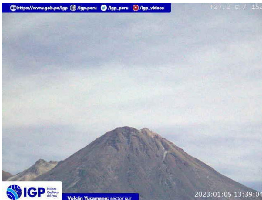
Figura 8.- Imagen de monitoreo del volcán Yucamane capturada por la cámara de monitoreo Yucamane, ubicada en el sector sur del volcán. La hora corresponde a formato UTC.