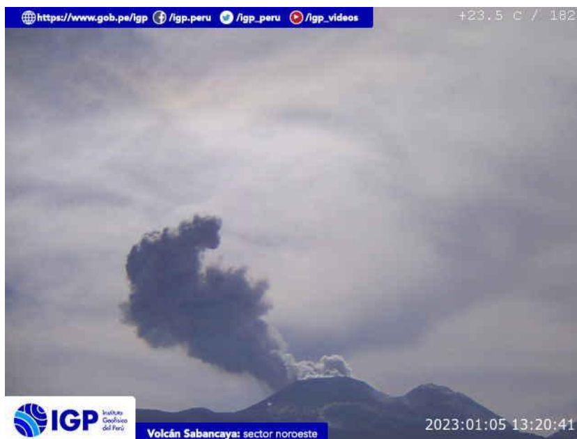
Figura 2.- Imagen de monitoreo del volcán Sabancaya capturada por la cámara de monitoreo Chivay, ubicada en el sector noreste del volcán. La hora corresponde a formato UTC.

Nivel de alerta volcánica actual: naranja .