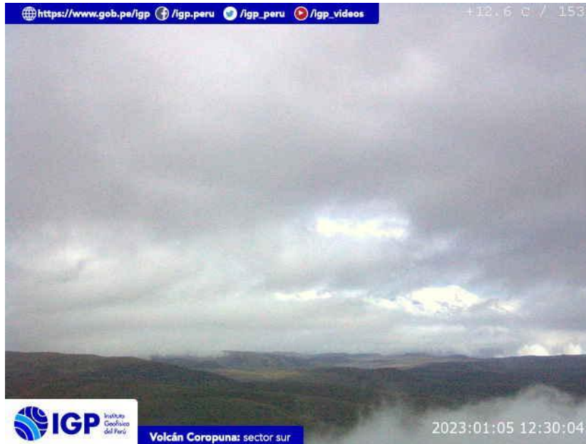
Figura 5.- Imagen de monitoreo del volcán Coropuna capturada por la cámara de monitoreo Coropuna 1, ubicada en el sector sur del volcán. La hora corresponde a formato UTC.