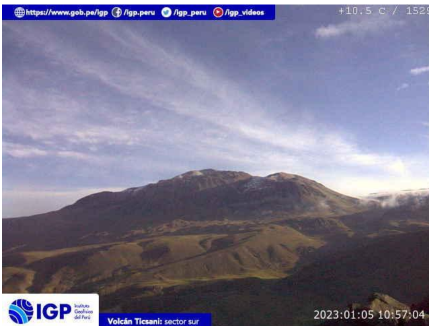
Figura 7.- Imagen de monitoreo del volcán Ticsani capturada por la cámara de monitoreo Ticsani, ubicada en el sector sur del volcán. La hora corresponde a formato UTC.