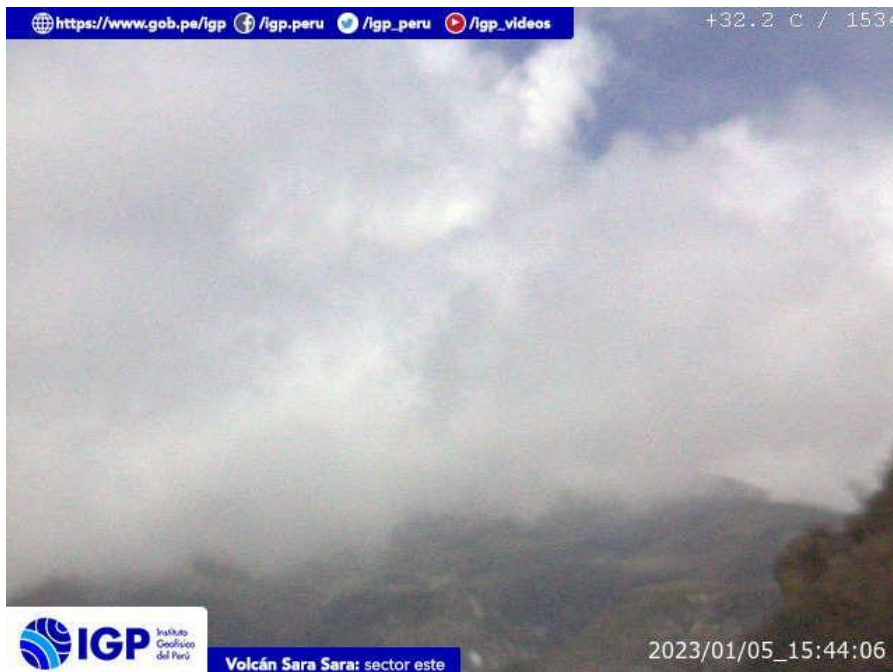
Figura 9.- Imagen de monitoreo del volcán Sara Sara capturada por la cámara de monitoreo Sara Sara, ubicada en el sector este del volcán. La hora corresponde a formato UTC.