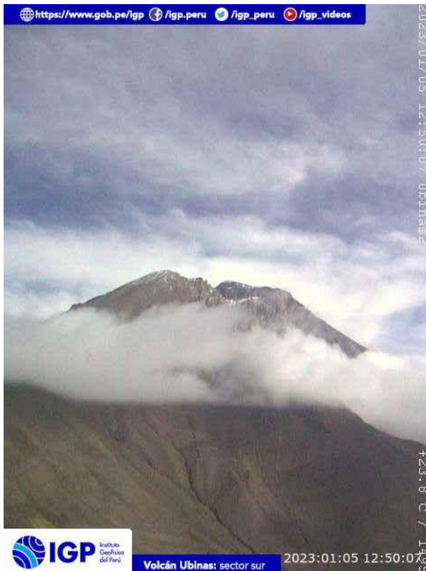
Figura 6.- Imagen de monitoreo del volcán Ubinas capturada por la cámara de monitoreo Ubinas 2, ubicada en el sector sur del volcán. La hora corresponde a formato UTC.