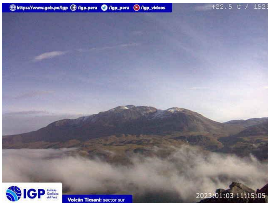
Figura 7.- Imagen de monitoreo del volcán Ticsani capturada por la cámara de monitoreo Ticsani, ubicada en el sector sur del volcán. La hora corresponde a formato UTC.