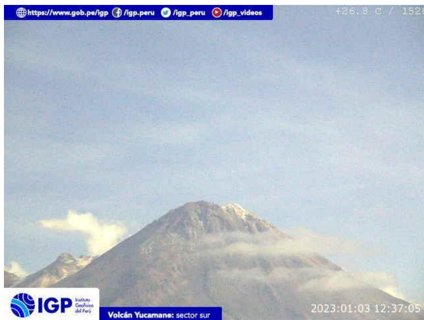
Figura 8.- Imagen de monitoreo del volcán Yucamane capturada por la cámara de monitoreo Yucamane, ubicada en el sector sur del volcán. La hora corresponde a formato UTC.