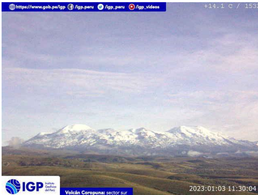
Figura 5.- Imagen de monitoreo del volcán Coropuna capturada por la cámara de monitoreo Coropuna 1, ubicada en el sector sur del volcán. La hora corresponde a formato UTC.