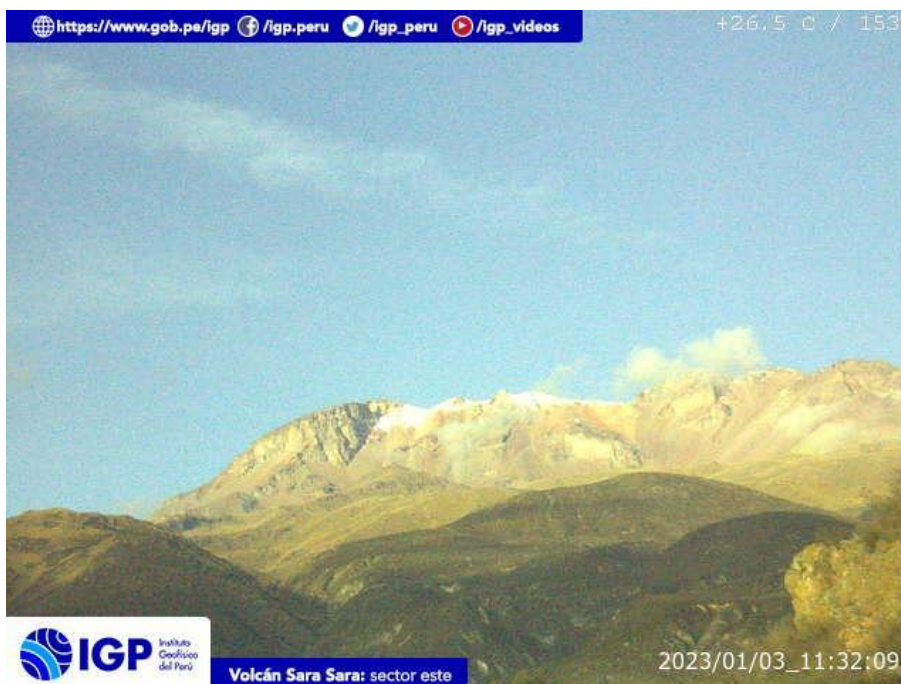
Figura 9.- Imagen de monitoreo del volcán Sara Sara capturada por la cámara de monitoreo Sara Sara, ubicada en el sector este del volcán. La hora corresponde a formato UTC.