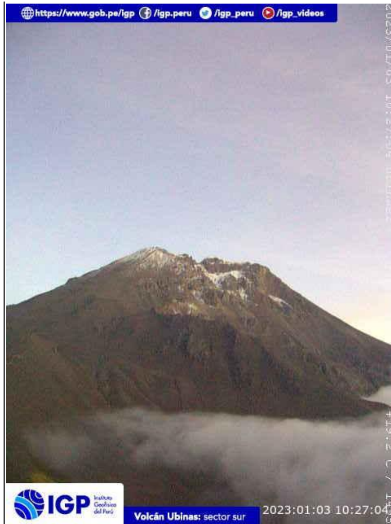
Figura 6.- Imagen de monitoreo del volcán Ubinas capturada por la cámara de monitoreo Ubinas 2, ubicada en el sector sur del volcán. La hora corresponde a formato UTC.