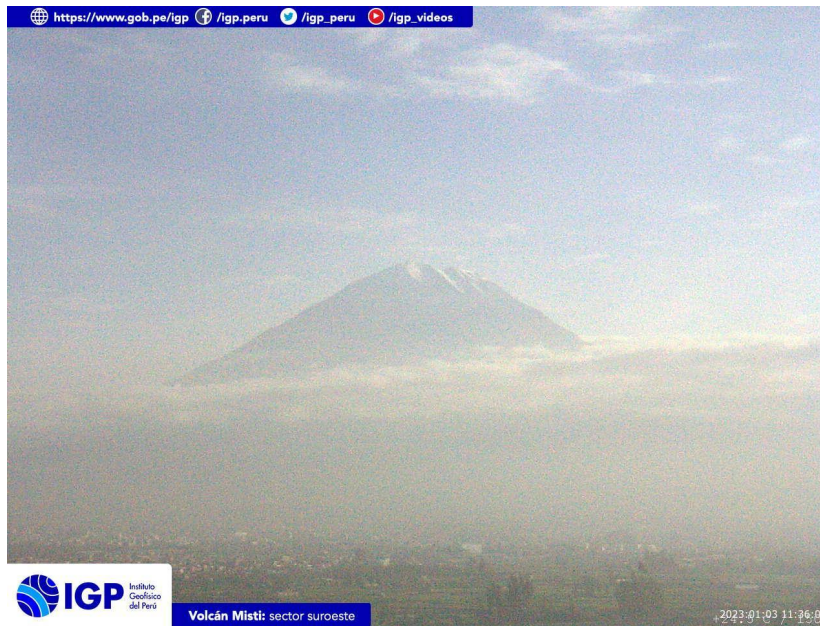
Figura 3.- Imagen de monitoreo del volcán Misti capturada por la cámara de monitoreo Misti 1, ubicada en el sector suroeste del volcán. La hora correspond e a formato UTC.