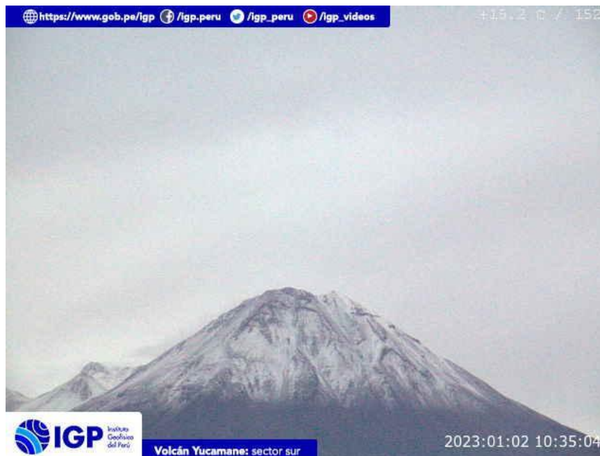
Figura 8.- Imagen de monitoreo del volcán Yucamane capturada por la cámara de monitoreo Yucamane, ubicada en el sector sur del volcán. La hora corresponde a formato UTC.