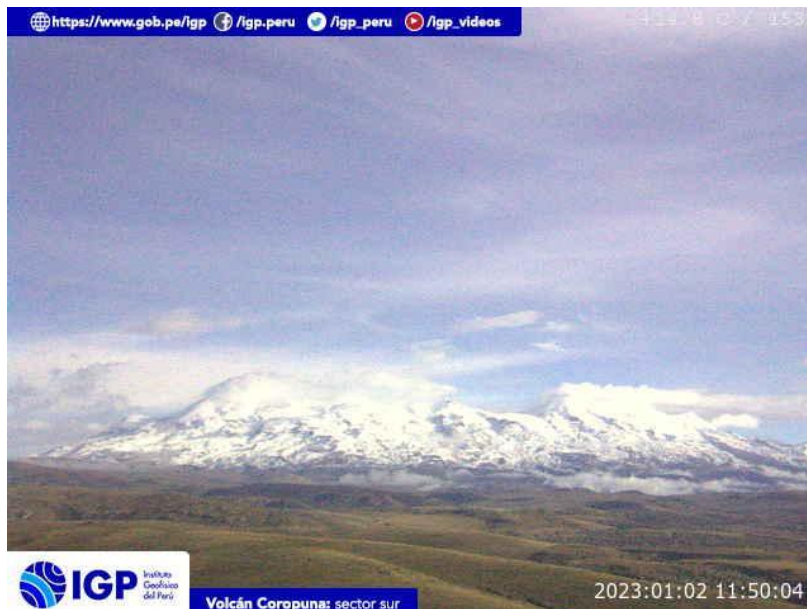
Figura 5.- Imagen de monitoreo del volcán Coropuna capturada por la cámara de monitoreo Coropuna 1, ubicada en el sector sur del volcán. La hora corresponde a formato UTC.