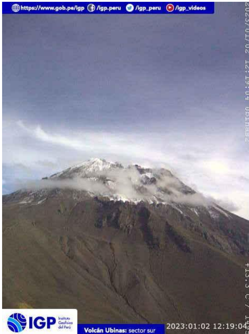
Figura 6.- Imagen de monitoreo del volcán Ubinas capturada por la cámara de monitoreo Ubinas 2, ubicada en el sector sur del volcán. La hora corresponde a formato UTC.