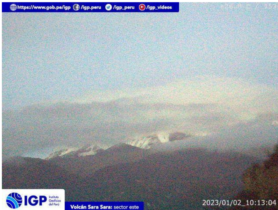
Figura 9.- Imagen de monitoreo del volcán Sara Sara capturada por la cámara de monitoreo Sara Sara, ubicada en el sector este del volcán. La hora corresponde a formato UTC.