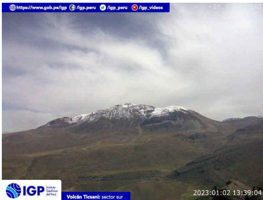
Figura 7.- Imagen de monitoreo del volcán Ticsani capturada por la cámara de monitoreo Ticsani, ubicada en el sector sur del volcán. La hora corresponde a formato UTC.