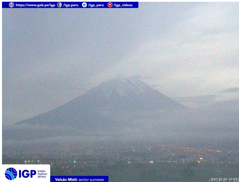
Figura 3.- Imagen de monitoreo del volcán Misti capturada por la cámara de monitoreo Misti 1, ubicada en el sector suroeste del volcán. La hora correspond e a formato UTC.