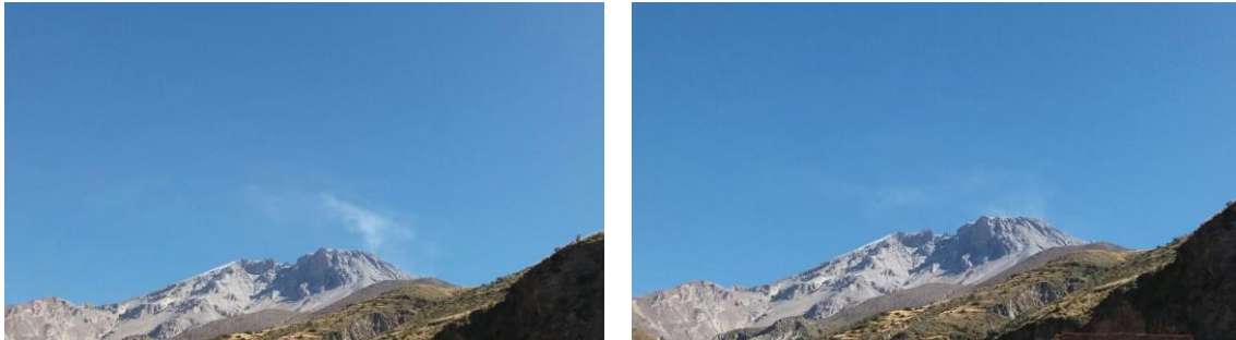
Figura 2.- Emisiones esporádicas de gases azulinos (gases magmáticos) en el volcán Ubinas.