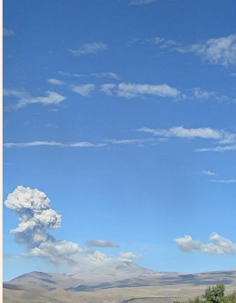
Emisión de ceniza y gases (27 de mayo de 2017)

Volcan Sabancaya / Sat 27 May 08:12:02 PET 2017