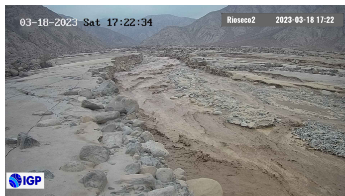
Figura 2.- Inicio de evento