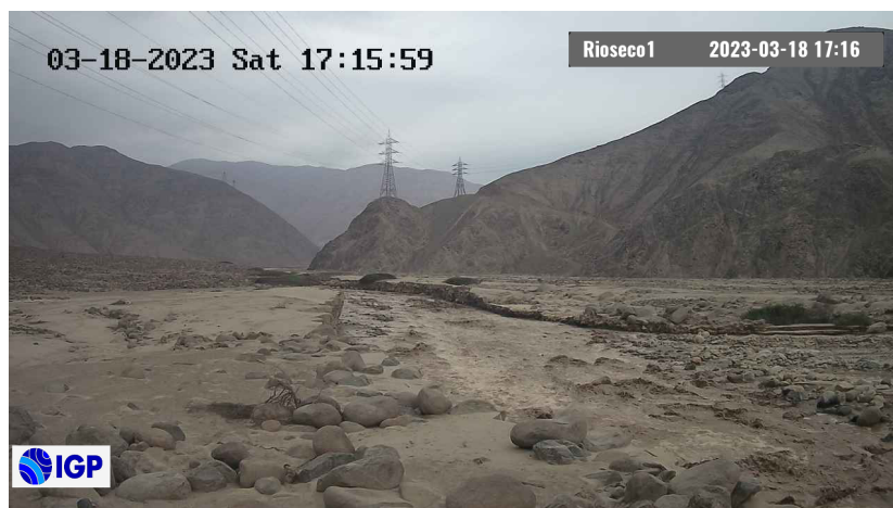
Figura 2.- Inicio de evento