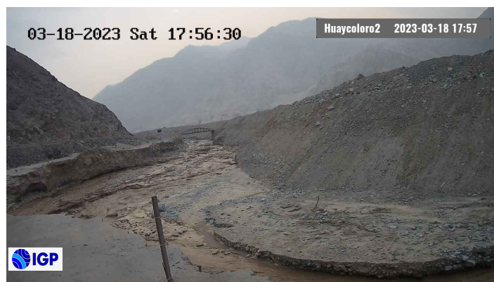
Figura 2.- Inicio de evento