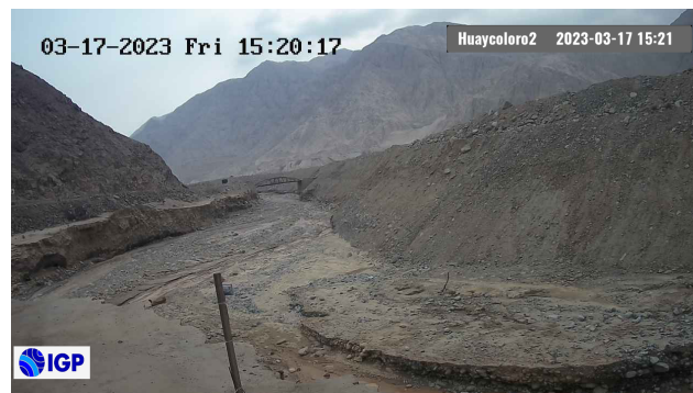
Figura 2.- Inicio de evento