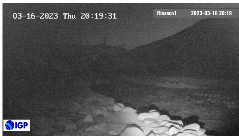
Figura 2.- Inicio de evento