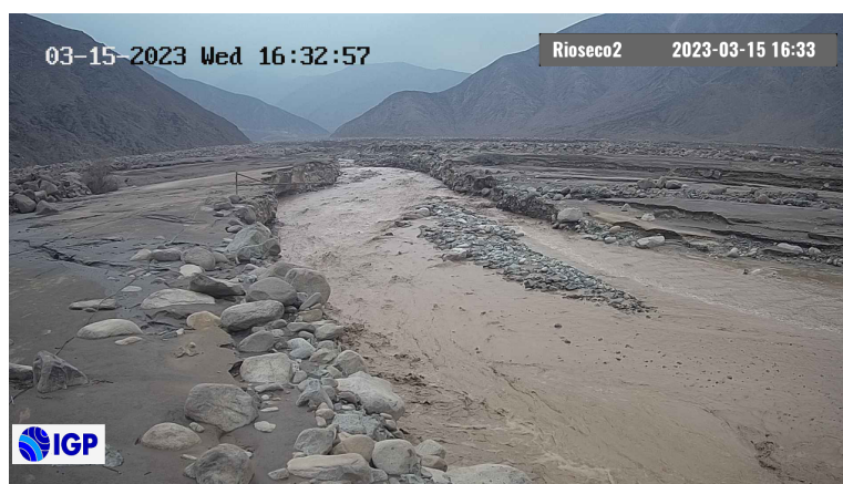
Figura 2.- Inicio de evento