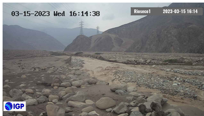
Figura 2.- Inicio del evento