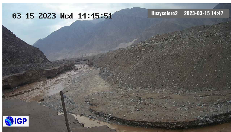
Figura 2.- Inicio de evento