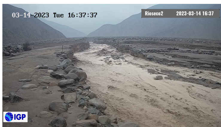
Figura 2.- Inicio de evento