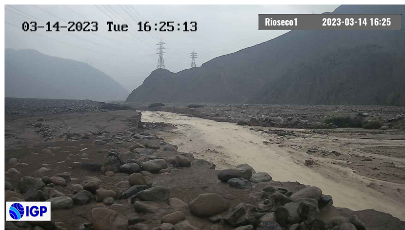
Figura 2.- Inicio de evento