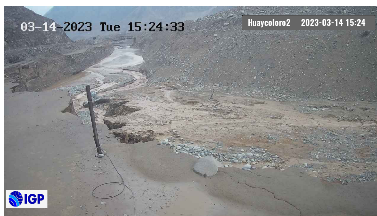
Figura 2.- Inicio de evento