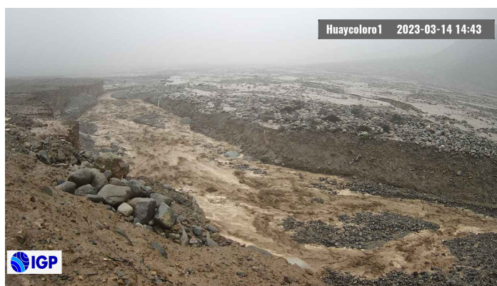
Figura 2.- Inicio de evento