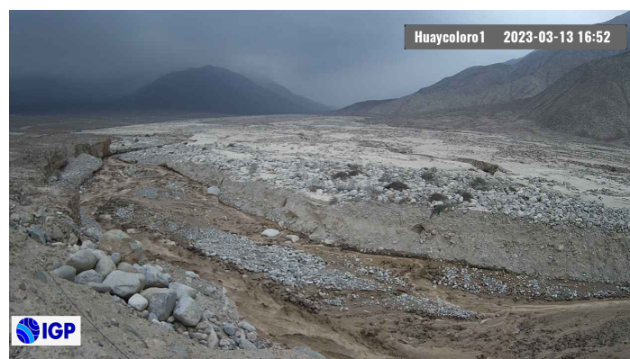
Figura 2.- Inicio de evento