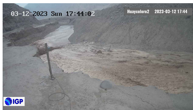
Figura 2.- Inicio de evento