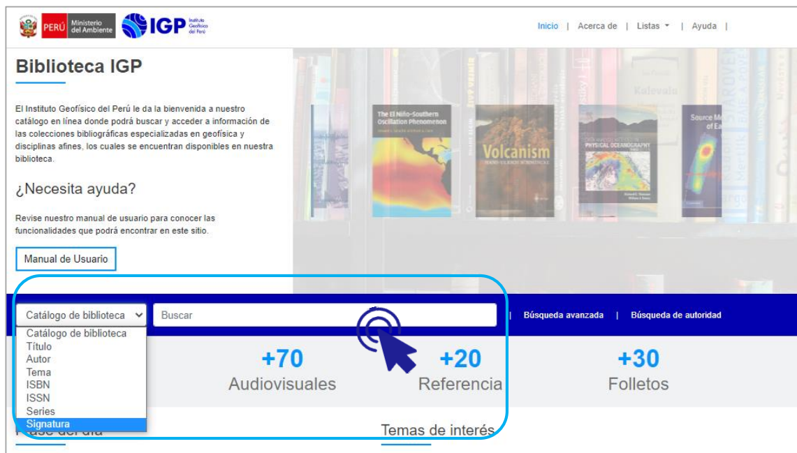
Figura 2: Buscador del catálogo en línea

El catálogo de biblioteca contiene una caja principal de búsquedas ( Figura 2 ). Para navegar en el catálogo en línea debe ubicarse en el lado izquierdo del buscador, seleccionar una opción del menú desplegable (Título, Autor, Tema, ISBN, ISSN, Series, Signatura) y colocar el término de su interés.